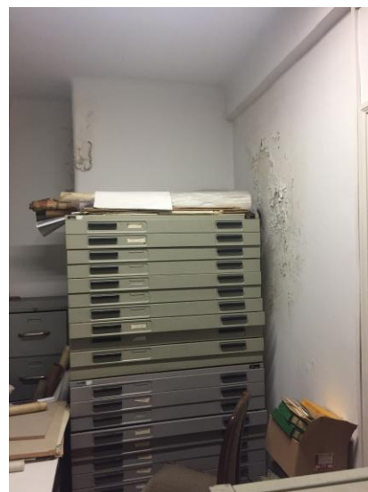
влага на зидовима просторије за архивирање документације