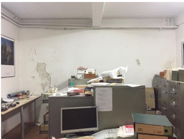
влага на зидовима у фототеци

постојеће стање сутерена Републичког завода за заштиту споменика културе - Београд