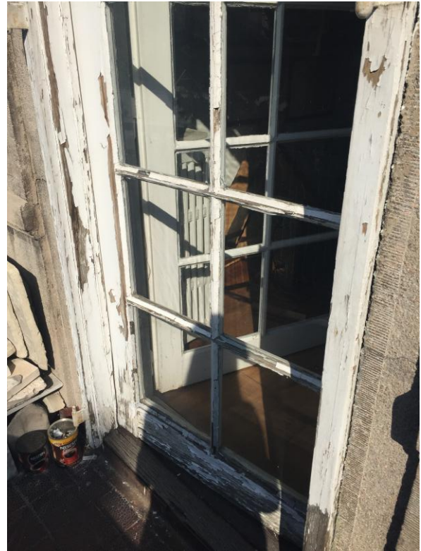
постојеће стање столарије