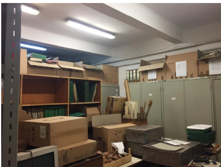
недовољно простора за складиштење документације