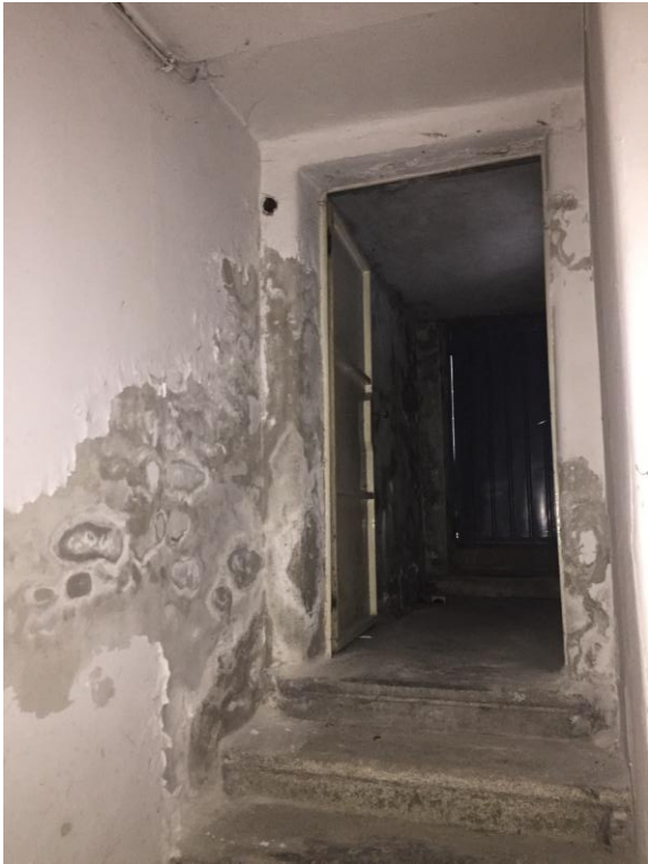
влага на зидовима ходника сутерена