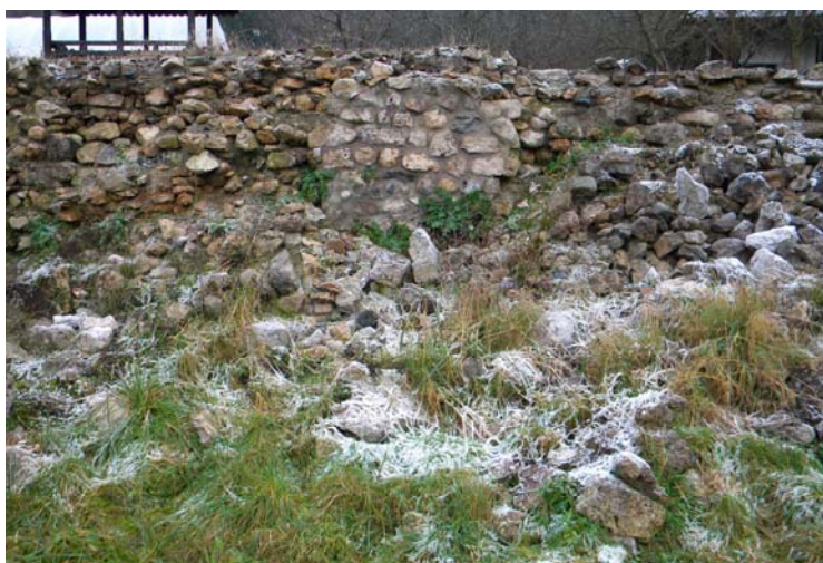
Сл. 4, Јужни зид кухиње, после урушавања

Приликом демонтаже (због оштећења и поновне обнове), елементи или делови зидова депонују се у непосредној близини првобитног положаја и обележавају (одређени комади). Делови зидова (који су рађени бољом техником) који се руше због недовољне стабилности обнављају се укампадама од по 1,5 m и камен враћа, прецизно, пажљиво на исто место.