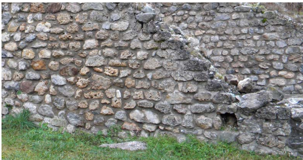
Сл 5. Техника зидања.

Све спојнице у зиду, како у његовом језгру, тако и у фасадном слогу, морају бити потпуно испуњене малтером без шупљина.