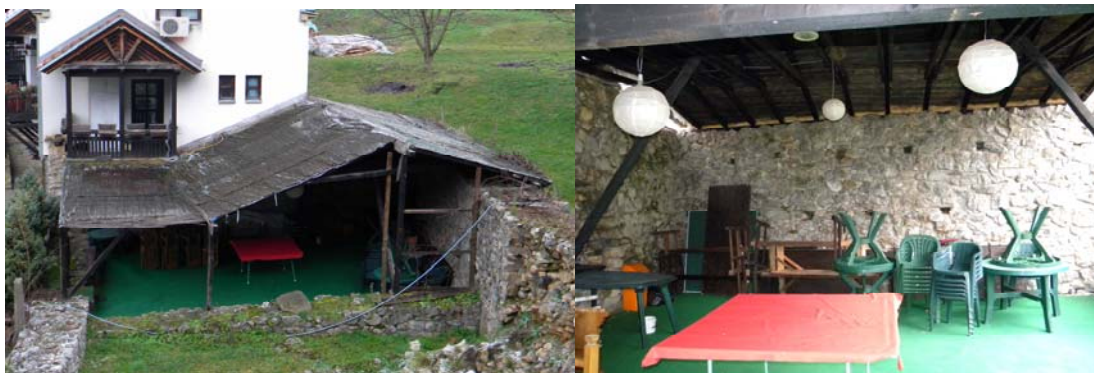
Сл. 3, Импровизирана надстрешница над просторијом 2, у комплексу кухиње.

Употребљиви материјали и предмети који пројектом нису предвиђени за поновно уграђивање, изнети из објекта (вертикални транспорт), однети на просечну удаљеност до 100 m (хоризонтални транспорт) и складирати по врстама материјала и величини предмета и тако предати инвеститору.