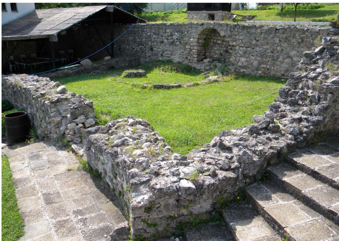
Сл. 2, Објекат санације и конзервације – манастирска кухиња

Конзерваторско рестаураторски радови подразумевају враћање свих елемената у стање најближе ономе из предходне фазе радова на презентацији комплекса, применом истих техника обраде материјала и специфичних занатских радова на обнови трошних и оштећених елемената, али уз побољшање статичко конструктивних својстава зидне структуре.