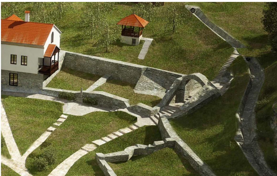
Сл. 1) Зона интервенције-југозапад, објекат манастирске кухиње

Радови на конзервацији, рестаурацији, конструктивној санацији и санацији од утицаја подземне воде и влаге грађевина које припадају југозападном сектору манастирског комплекса, подразумевају потез који сачињавају манастирска трпезарија, главни улаз и кухиња.