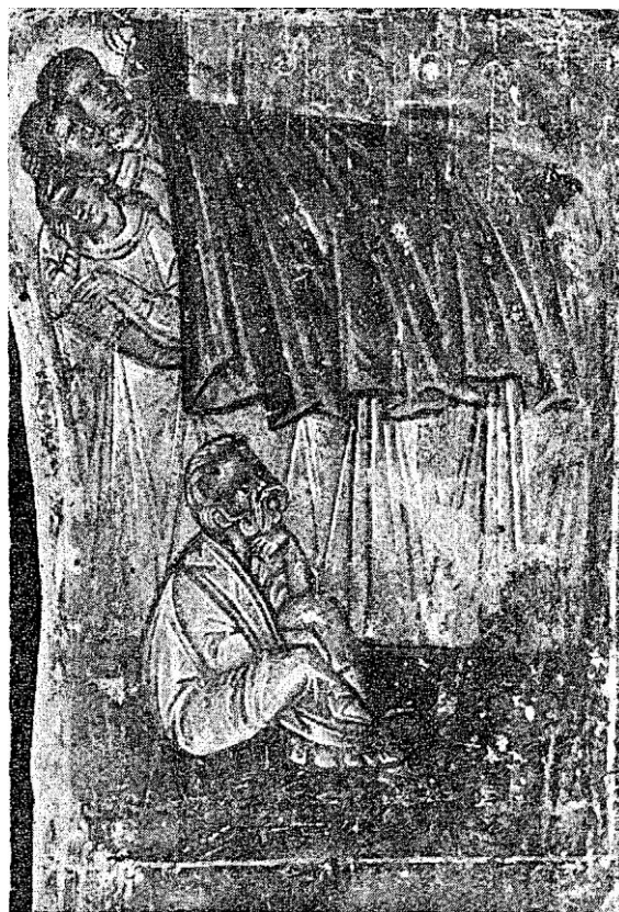
Сл. 7. — Св. Никола спасава три сестре (деталј композиције)