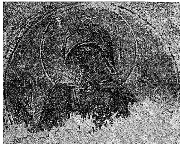
Сл. 5. — Св. Антоније

почетка пропадања државе, И у рамаћкој цркви они су најбројнији. Насликани су у ратној опреми, наоружани стрелом, копљем или кратким мачем, а на глави имају бисерне венце или кроз косу провучене беле траке са залепршаним крајевима. Нарочито је успело сликана фигура ратника са приклоњеном главом, на северном зиду, који врховима прстију додирује своју стрелу (сл. 4). Једном је већ речено да је „у Србији деспота створено необично оесећајно сликарство... уметност утехе...“ Ратници грациозних ставова и меких покрета са анђеоским тракама у коси, потврдиће још једном ово мишљење.