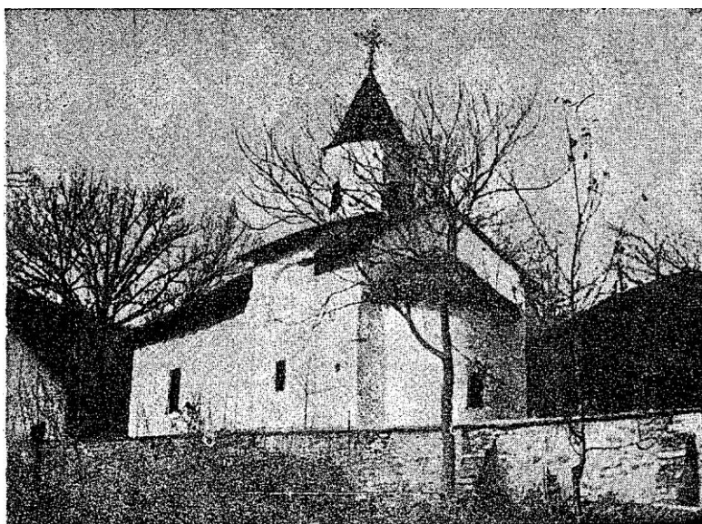
Сл. 1. — Црква у Рамаћи

Приликом рекогносцирања Крагујевачког среза, лета 1955 године, једна екипа Завода за заштиту и научно проучавање споменика културе НР Србије обишла је и цркву св.Константина и Јелене у селу Рамаћи, 7 км јужно од Страгара (сл. 1). Одмах, при првом сусрету, видело се да се ради о средњевековној цркви, невеликој додуше, скромној и по облику и по материјалу 1 . Ал оно што је код ње било нарочито занимљиво то је неколико лепо очуваних фресака, намерно остављених