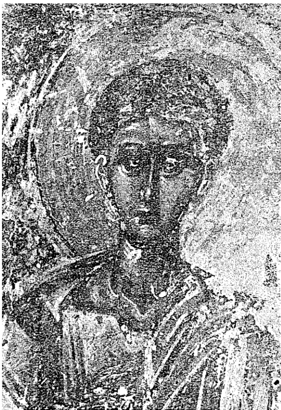
Сл. 6. — Светитељ са северозападног пиластра

извесне разлике у квалитету, у сликарском поступку, у форматима фресака који се местимично нагло мењају. Због свега тога добија се утисак стила који је у формирању, коме још није нађен дефинитивни израз.