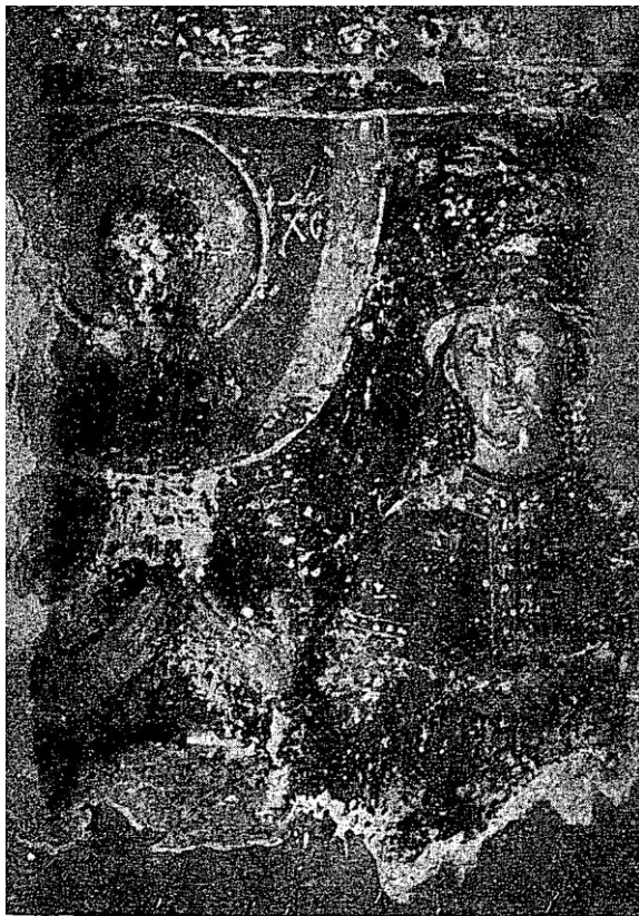
Сл. 3. — Владарска композиција

поред бочне, северне стране дата и источна и западна, показује да у својим основним облицима зграда није доцније много измењена. Беле површине зидова сведоче да је црква и првобитно имала омалтерисане и окречене фасаде, а интензивно црвена боја крова означавала би да је била покривена црепом или ћерамидом.