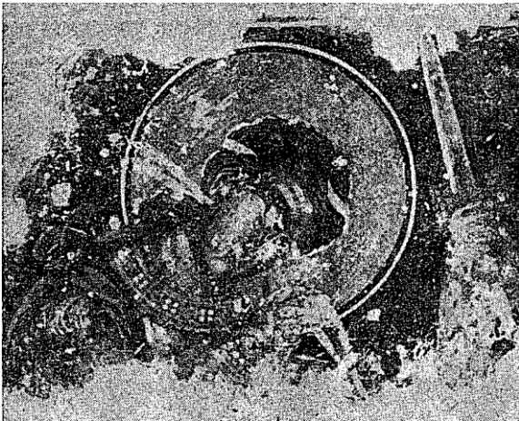
Сл. 4 — Св. ратник