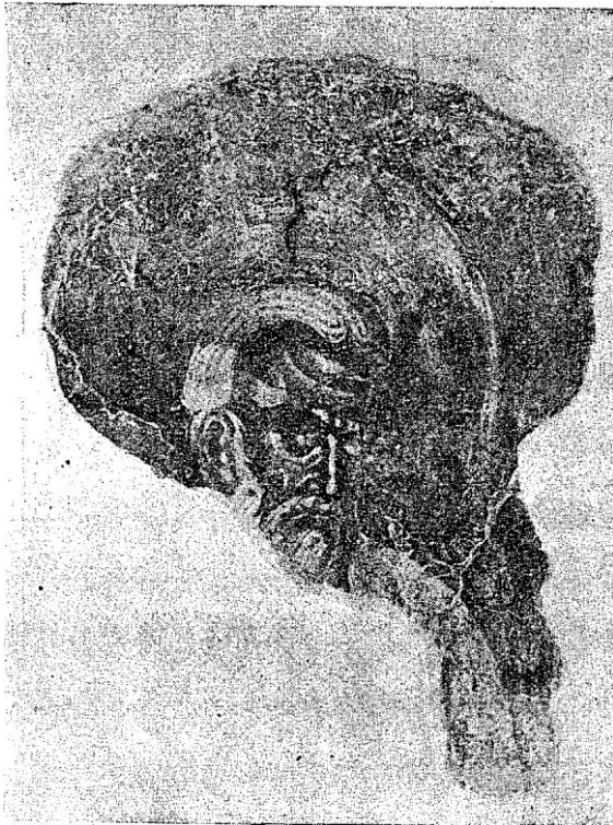
Фрагмент композиције „Духови“, из Граца