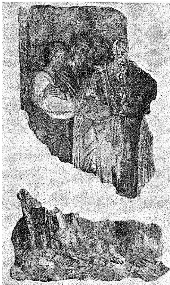
Градац: Причешће апостола

Dans les monastères de Djurdjevi Stubi près de Novi Pazar et Gradac près de Raška, ainsi que dans l'église qui se trouve au village de Palež, au Sud-Ouest de Studenica, qui sont en ruines depuis des dizaines d'années et dont l'état empire tous les jours, on a procédé au démontage des fresques les plus menacées qui ont été transportées au Musée National à Beograd où elles sont exposées. Les autres fresques de ces monastères et de l'église ont été renforcées et gardées sur les murs où elles se trouvaient.