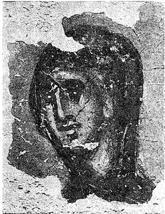
Фрагмент са „Успења“, из Палежа