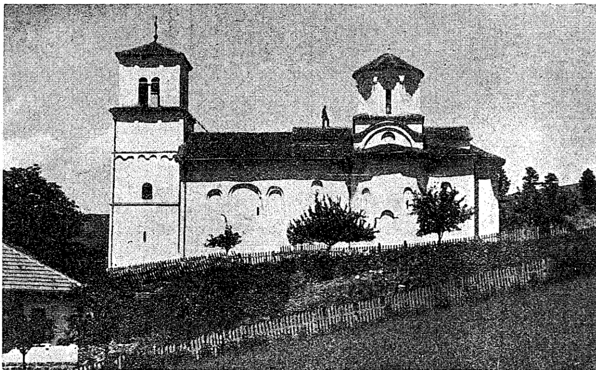
Сл. 2. — Нова Павлица данас