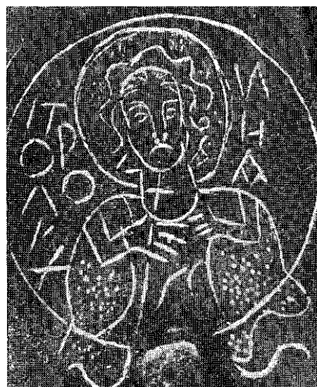
Сл. 6. Св. Полихронија. — Fig. 6. St. Polychronie.