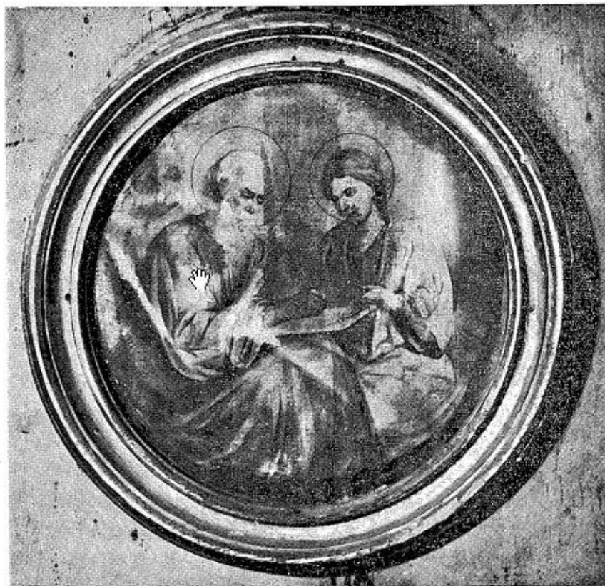
2. Горња Добриња, код Ужичке Пожеге, црква св. Петра и Павла, св. јеванђелист Матеј, детаљ са иконостаса, рад Ђорђа Крстића, 1883