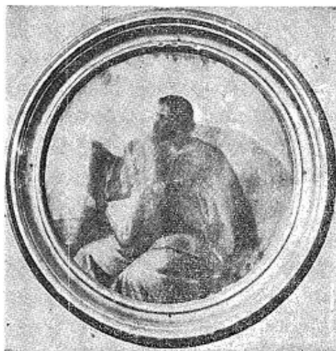
3. Горња Добриња, код Ужичке Пожеге, црква св. Петра и Павла, св. јеванђелист Лука, детаљ са иконостаса, рад Ђорђа Крстића, 1883