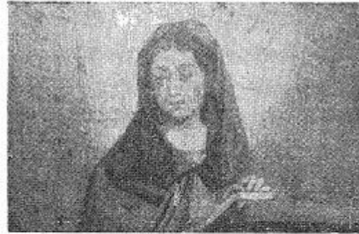
5. Горња Добриња, код Ужичке Пожеге, црква св. Петра и Павла, св. Богородица из Благовести на царским дверима, детаљ, рад Ђорђа Крстића, 1883

Година 1883. означавала је у Србији, за владе краља Милана, значајну јубиларну годину. То је 50то годишњица остварења српске националне аутономије (хатишериф из 1833.), 25то годишњица Светоандрејске скупштине и почетка друге владавине кнеза Милоша (1858—1860) и прва годишњица