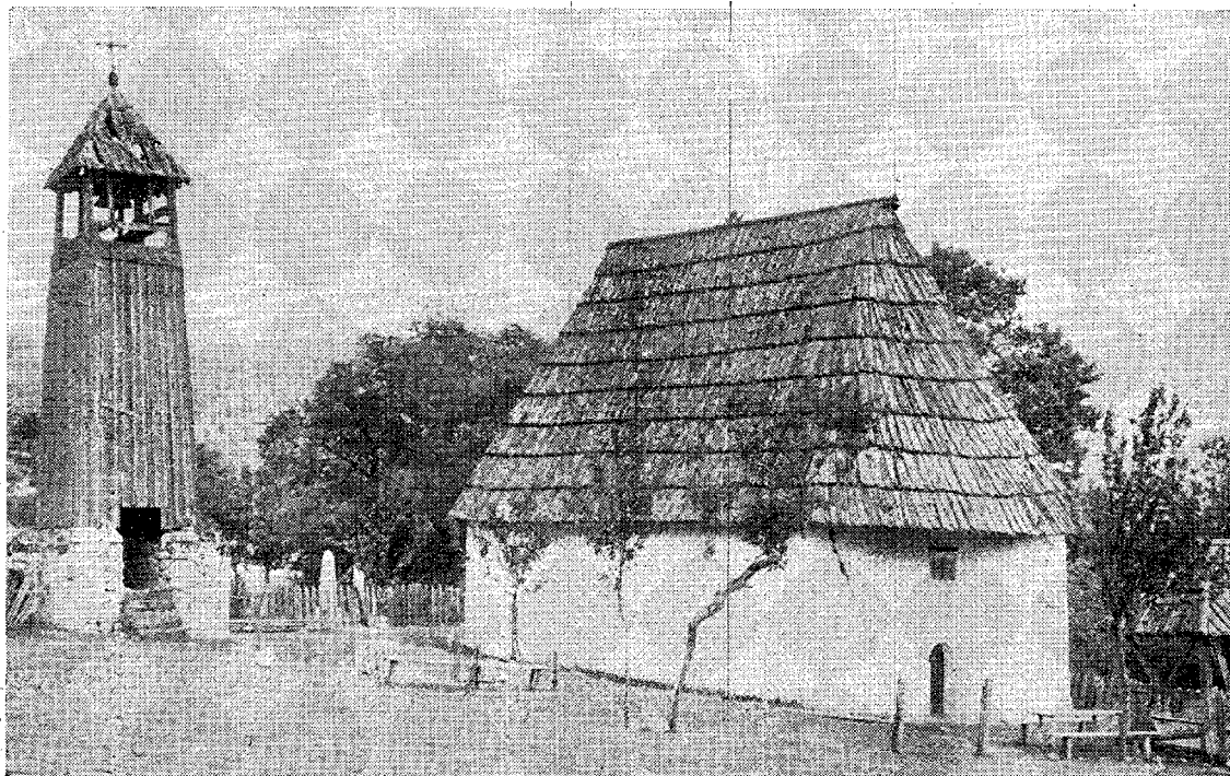
24. Бистрица код Нове Вароши: Дрвена звонара и црква од камена, слична брвнари — »Bistrica« près»Nova Varoš« campanile "de bois et église en-pierre, rappelant la construction de bois.