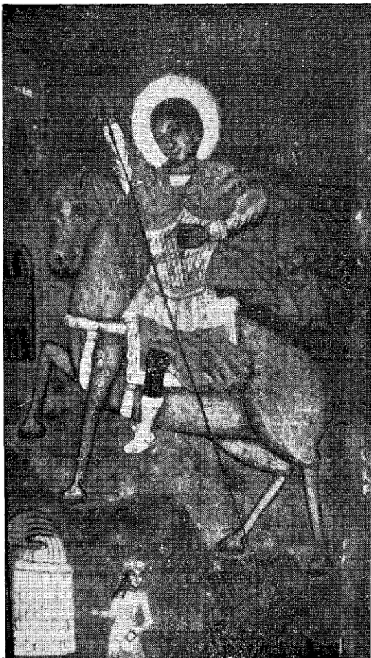
21. Покајница: Икона св. Ђорђа са записом о изградњи цркве — »Pokaјnica«: Icône de St. Georges avec inscriptions relatives à la construction de l'église.

На основу чега одређујемо када је подигнута једна црква брвнара? Реч је, наравно, о онима које су се сачувале, јер о другима можемо то сазнати само на основу писаних извора, а донекле и на основу предања. Подаци могу бити веома различити, више или мање одређени, те