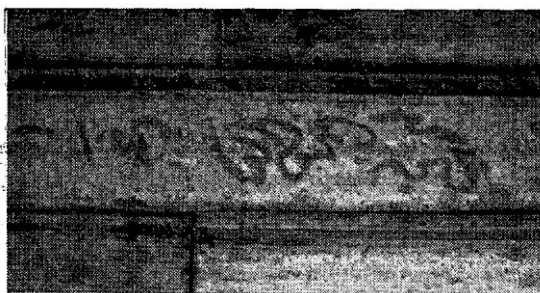
23. Рача Крагујевачка: Црвени запис са таванице трема — »Rača Krugujevačka«: Inscription au rouge au plafond du portique.

Дешава се да поједини извори различито пишу о истим стварима. Године се много пута не слажу. Међутим, и овде не мора бити нетачности. Ако је у питању мањи временски период — раздобље од једне, две или три године — неслатање може наступити услед тога што се један податак односи на почетак градње, други на крај, трећи на потпуно довршење храма заједно са иконама и осталим утварима, а четврти на освећење цркве. Ако је пак у питању дужи временски период, период од неколико деценија и читавог једног века, као што је случај у Рачи Крагујевачкој (1727 и 1827), то може значити да је на истом месту грађено, односно обнављано више храмова. Појам обнове означава врло често потпуно нову грађевину подигнуту на истом месту, услед чега и може доћи до различитих тумачења изградњи, обнове и поправки једне цркве брвнаре.