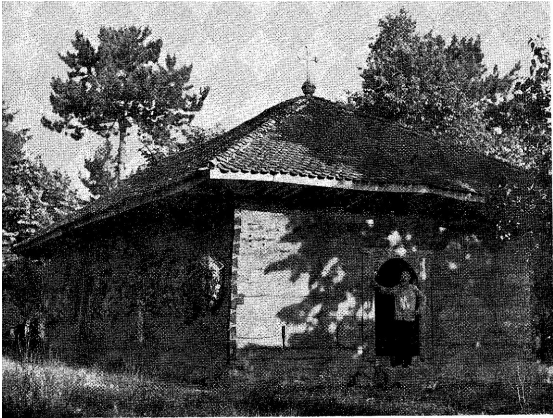
27. Црква у Смедеревској Паланци — Eglise de »Smederevska Palanka«.

Приликом оцене једне овакве архитектуре не смемо заборавити да су у питању храмови веома скромних могућности, стварани од стране скромних сеоских дрводеља, под одређеним условима и са ограничењима економским и политичким.