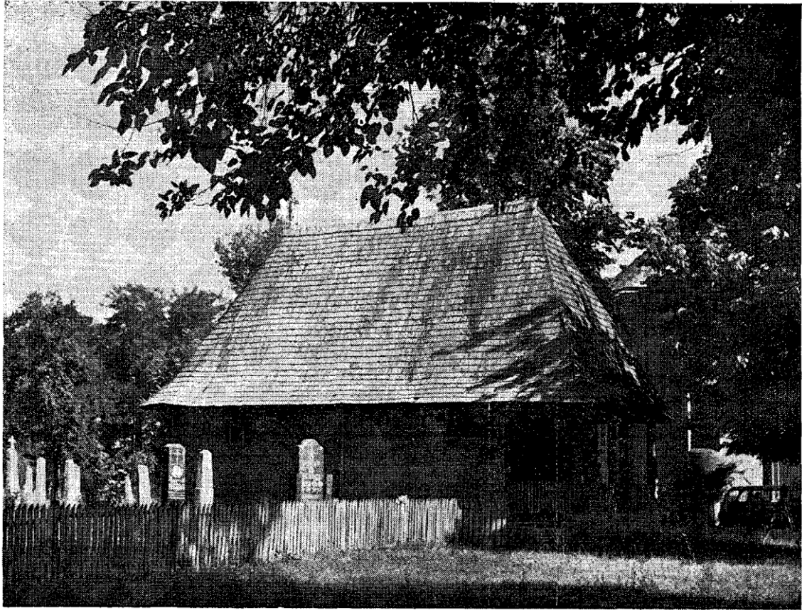
26. Црква у Лозовику — Eglise de »Lozovik«.

ским, румунским или нордијским дрвеним црквама, које су знатно већих размера и сложенијих облика, она има пуно својих квалитета, своју врсту монументалности, што ствараоци дрвених храмова ван Србије нису успели да реализују на тако малим објектима. У томе се баш и састоји вредност архитектуре цркава брвнара у Србији (сл. 77).