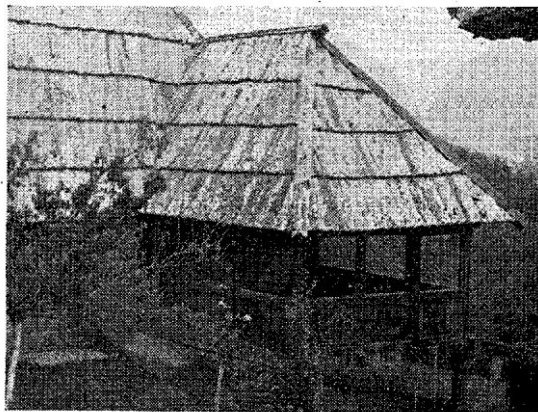
25. Горња Црнућа: Кућа брвнара кнеза Милоша — »Gornja Crnuća«: Maison en bois du Prince Miloch.

Осађански мајстори из времена кнеза Милоша били су у том погледу прави мајстори. Оно што су створили у Рачи Крагујевачкој или у појединим другим местима заиста представља успело архитектонско решење своје врсте. Иако то није архитектура слична руским, пољ-