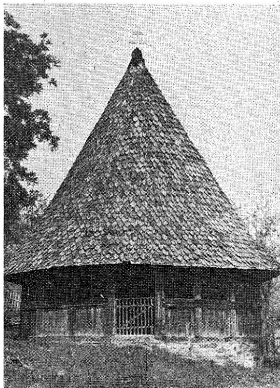
29. Црква у Дубу — Eglise de »Dub«.