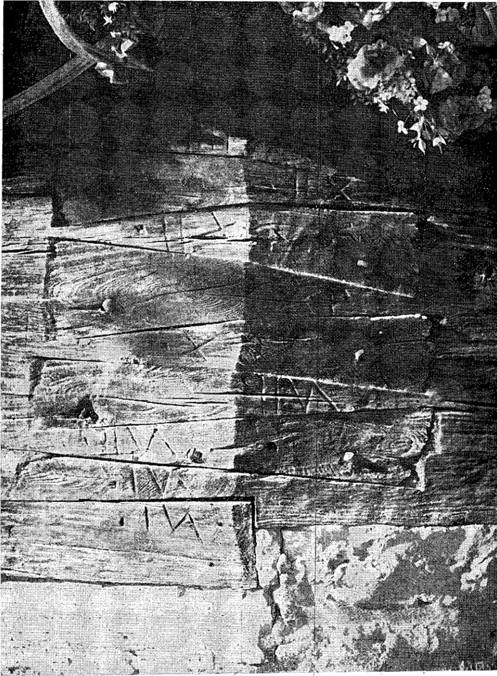
19. Смедеревска Паланка: Угаоне везе, на олтарскрј апсиди, са урезаним ознакама" на свакој талпи – »Smederevska Palanka«: Emboîtements aux angles de l'abside du sanctuaire; signes entaillés à même les madriers.

вих црква допуштала је да се оне премештају уколико би настала потреба за погоднијим местом. Свако доба и све