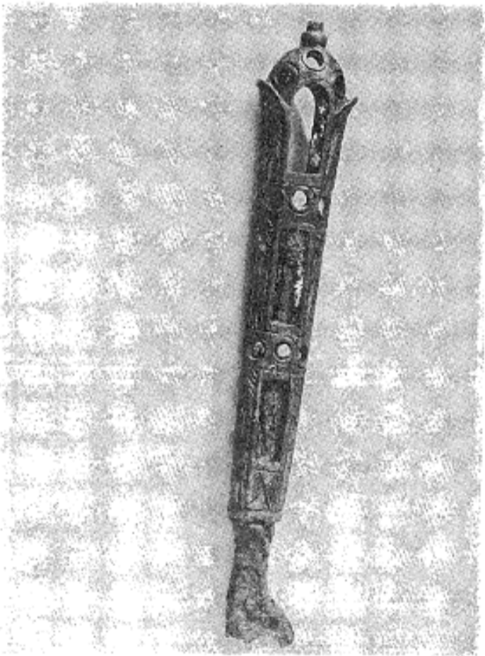
116. Дршка ножића са инкрустацијама од седефа, 1971. г., Р. Живковић.