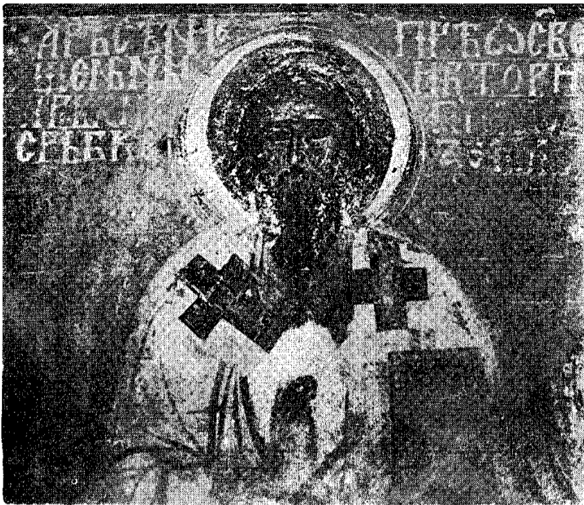
Сл. 5. Приправа Богородичине цркве у Студеници, капела св. Симеона Немање, архиепископ Арсеније I, други српски архиепископ (1234—1263), детаљ

Fig. 5. Narthex de l'église de la Vierge à Studenica, chapelle saint Siméon Nemanja, archevêque Arsenije I, second archevêque serbe (1234—1263), détail.