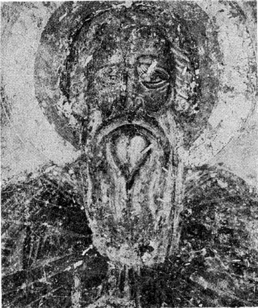
Сл. 1. Припрата Богородичине цркве у Студеници, капела св. Симеона Немање, Стефан Немања, детаљ

Fig. 1. Narthex de l'église de la Vierge à Studenica, chapelle saint Siméon Nemanja, Stéphane Nemanja, détail.