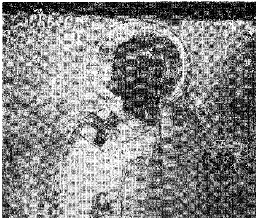
Сл. 6. Припрата Богородичине цркве у Студеници, капела св. Симеона Немање, архиепископ Сава I, први српски архиепископ (1219—1234), детаљ Fig. 6. Narthex de l'église de la Vierge à Studenica, chapelle saint Siméon Nemanja, archevêque I., premier archevêque serbe (1219—1234), détail.

Од посебног је значаја анализа портрета Арсенија I (сл. 5). И овде је сликар најпре поступио по ерминији. Зеленом је означио лице, косу и браду а патом досликавао окером, црвеним, сиеном и другим бојама, како би портрет сликаног био што вернији. Кад је моделирао портрет Арсенија I, видео је да му браду зеленом није добро насликао, јер му је испала краћа, шиљата и уска, па је индијско-црвеним не само