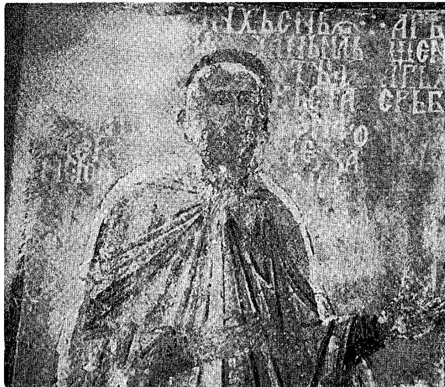
Сл. 4. Приправа Богородичине цркве у Студеници, капела св. Симеона Немање, јеромонах Сава, доцније архиепископ Сава II (1263—1271), детаљ