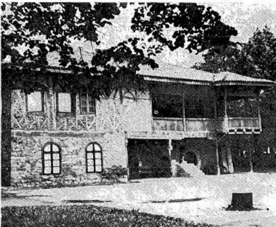
Сл. 6. Господар Јованов конак у Чачку и господар Васин конак у Краљеву, два значајна споменика народног градитељства које је служба заштите споменика културе Србије конзервирала и обновила у првим годинама свог послератног деловања.

Fig. 6. Gospodar Jovanov konak (konak du seigneur Jean), à Čačak et le konak de Vasin à Kraljevo, deux monuments importants de l'architecture populaire que le service de la protection des monuments culturels de Serbie a conservé et restauré dans les premières années de son activité d'après-guerre.