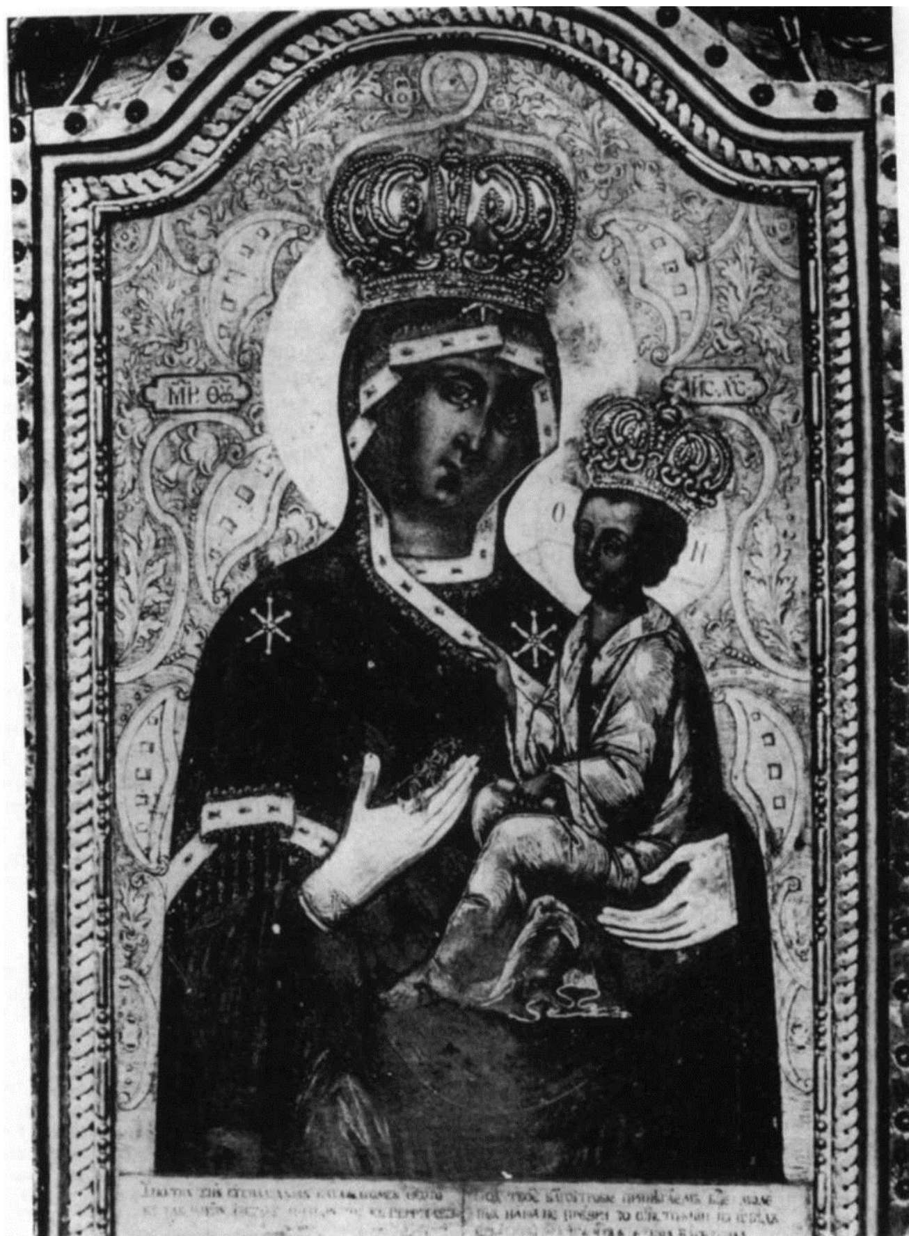
Сл. 5. Икона на Богородичином трону из 1785. год. Богородичиног храма у Земуну