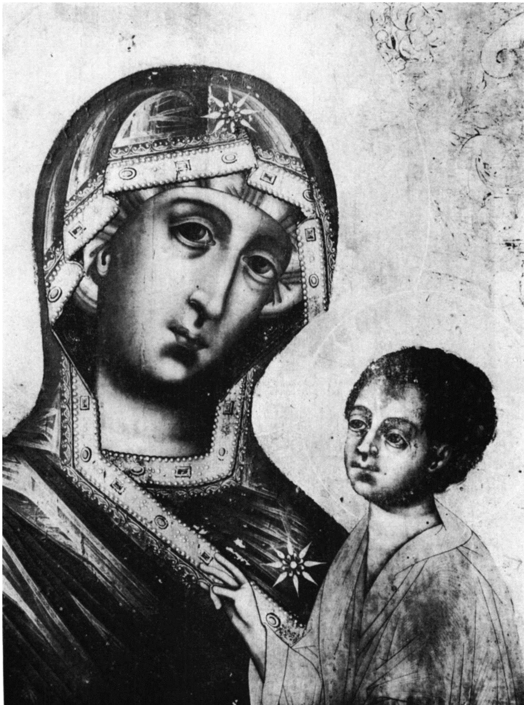
Fig. 3. La Vierge miraculeuse de Velika Remeta, oeuvre de Spiridon Grigoriev, peintre russe, exécutée en 1687, détail

Сл. 3. Великореметска чудотворна Богородица, рад сликара Сп. Григорјева из 1687 — детаљ