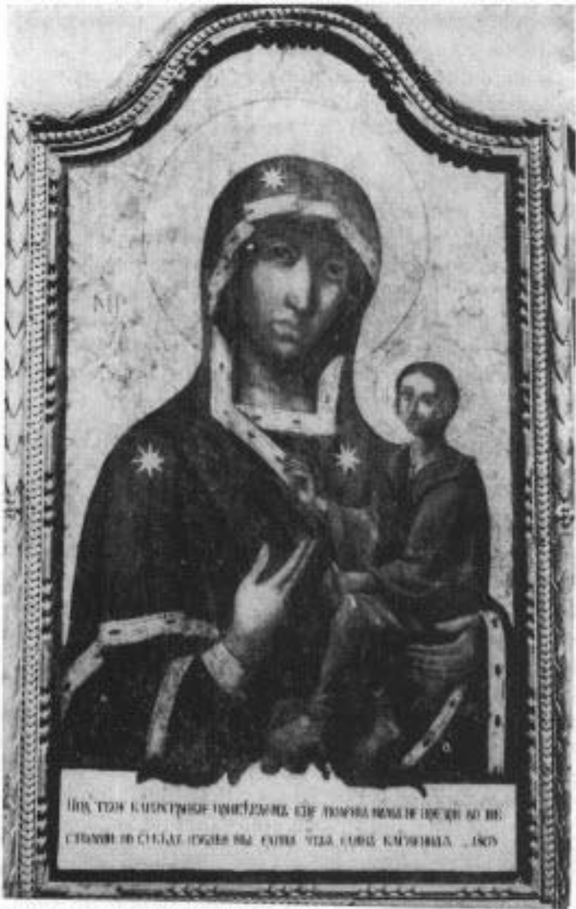
Сл. 6. Богородица Одигитрија, рад сликара Николе Апостоловића из 1803. год. у Ст. Бановцима

Fig. 6. La Vierge Hodighitrie, oeuvre de Nikola Apostolović, peintre de Zemun, exécutée en 1803 et conservée à l'Église orthodoxe de Stari Banovci.