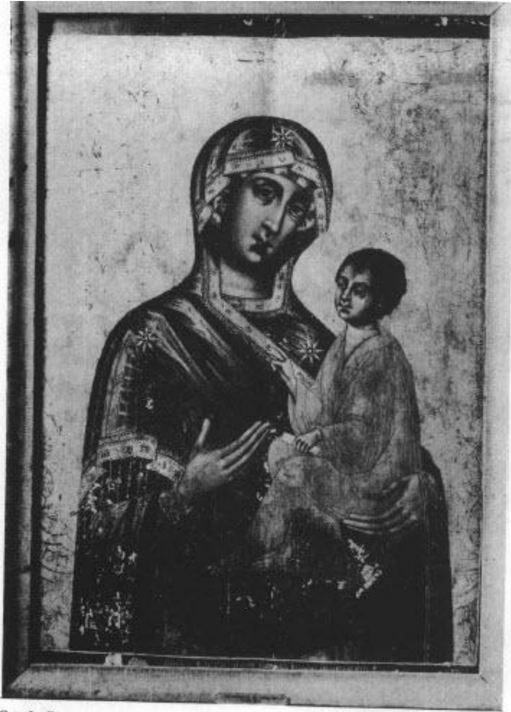
Сл. 2. Великореметска чудотворна Богородица, рад сликара Спиридона Григорјева из 1687. године