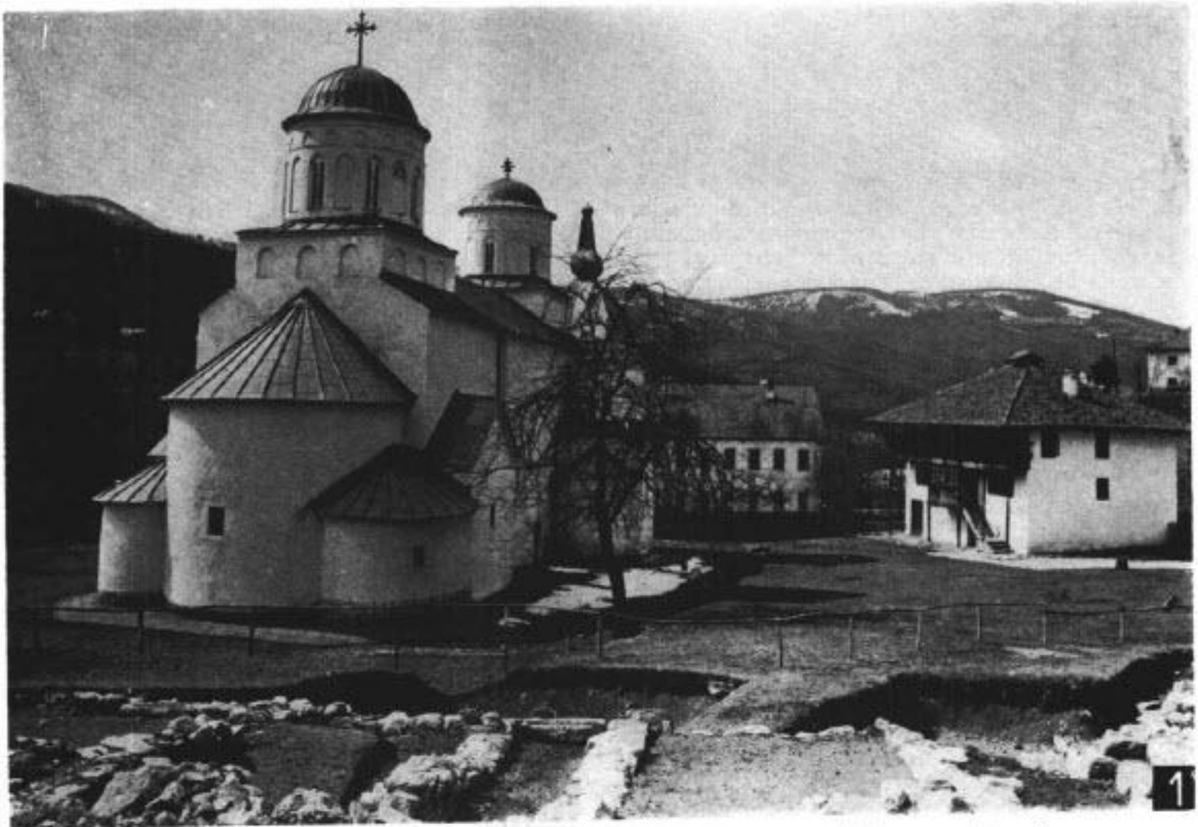
Сл. 2. Манастир Милешева, новооткривени остаци манастирских грађевина