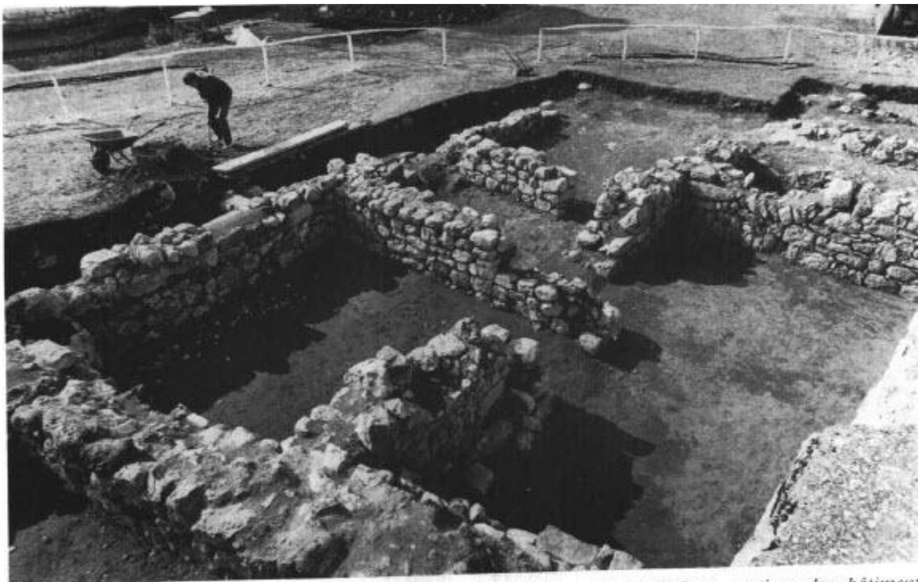
Сл. 3. Манастир Милешева, новооткривени остаци манастирских грађевина