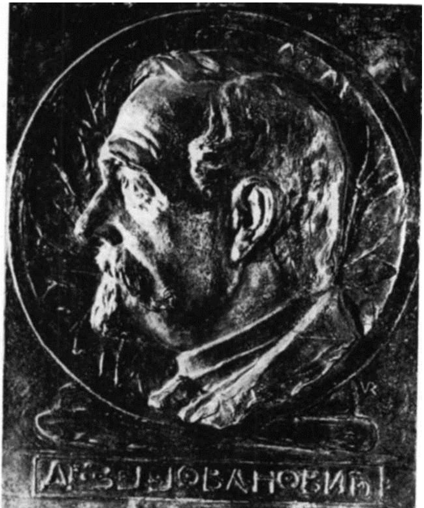
Сл. 3. Рудолф Валдец, Змај Јован Јовановић, рељеф

Садржина списка откупљених уметничких дела, посебно својим прегледним подацима, препоручује се пажњи. Рубрике са именима аутора, називима њихових дела и свотама потпуније објашњавају првобитну праксу Галерије и потврђују поједине одредбе из њеног Правилника. Заступљена у готово подједнаком броју, дела хрватских и словеначких уметника, уз мноштво радова српских стваралаца које Народни музеј чува одраније, чине основну збирку. Већина слика, реч је о пејзажима из Хрватске, Словеније и са јадранске обале, и основном садржином спонтано одражавају расположења и пробуђене политичке наде југословенског живља. Покренута са Првом југословенском