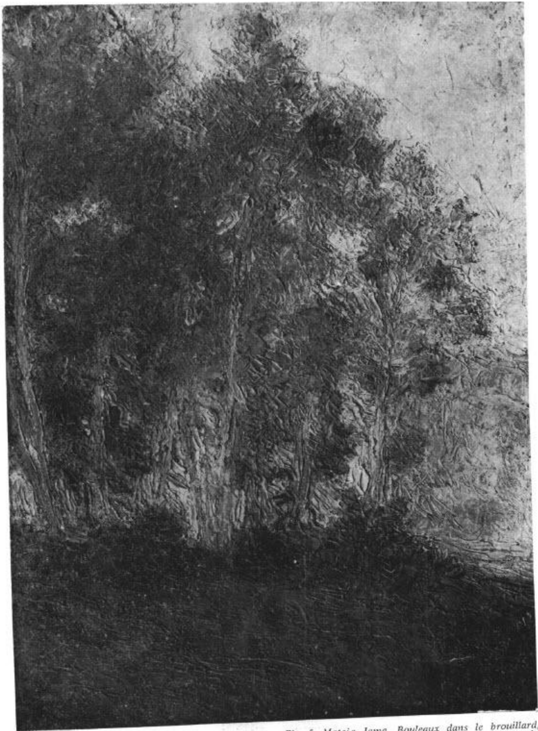
Сл. 5. Матеја Јама, Брезе (у магли), уље на платну