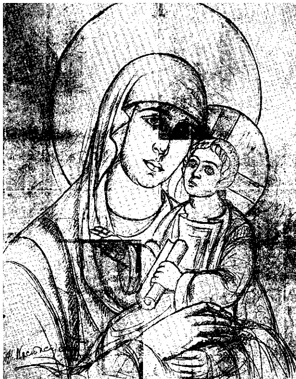
Сл. 3. Скица св. Богородице са Христом по којој је обновљена слика на зиду у капели костурнице, својина Дома културе у Г. Милановцу Fig. 3. Esquisse de la Vierge à l'Enfant, suivant laquelle fut restaurée la fresque sur le mur de la chapelle. L'esquisse appartient à la Maison de la culture de Gornji Milanovac

угловима по један и на левој и десној страни од прилазног степеништа за терасу такође по један. Стубове је највероватније требало повезати металним цевима или ланцима. Простор око костурнице, и даље од ње, пошумљен је 1935. год. боровим садницама (10 000). 9 Да би се саднице заштитиле од стоке која је пасла на Мачковом камену, меморијал је исте године ограђен бодљикавом жицом. 10 Према сачуваним архивским подацима сазнаје се да су тражена финансијска средства за ограду, за куповину бодљикаве жице и око 259 комада храстових греда дугих 2 m и пречника 14 cm. 11 Ограда је имала двокрилну дрвену капију с бетонским стубовима и плочама с посветом, купљеним у металној радионици „Солид“ у Београду. 12 После другог светског рата постављена је друга ограда. Уместо бодљикаве жице стављена је плетена, а дрвена врата замењена су металним.