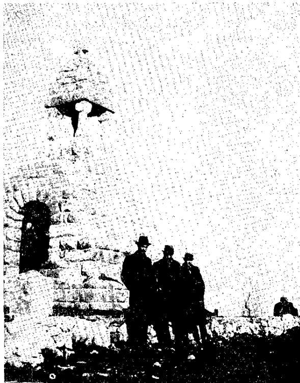
Сл. 4. Спомен-костурница на Мачковом камену, изглед споменика са потпорним зидом и каменим стубовима, фотографија Архива Југославије, сним. пре II св. рата

У капели спомен-костурнице сачувани су трагови постојања зидне слике: омалтерисана површина на којој је била слика и пигменти боја. Да би се слика могла обновити, како