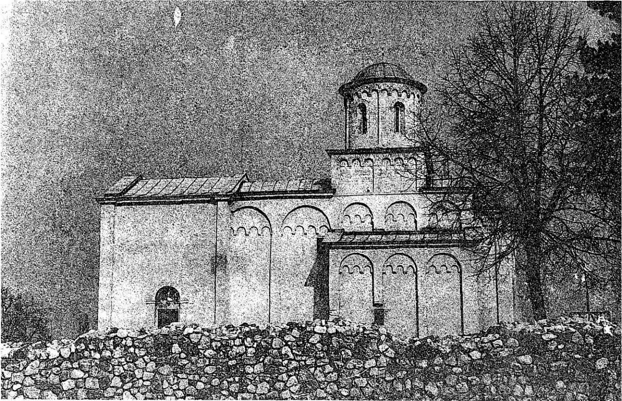
Сл. 1 Ариље, црква Св. Ахилија, јужни изглед