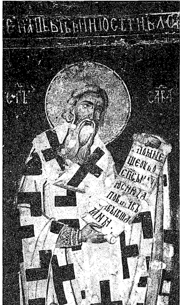
Сл. 2 Св. Сава (Јерусалимски), средишњо олтарска апсида, црква Светих апостола, Пећка патријаршија, око 1260.

Истичем „готово у исто време“, јер ако су фреске средишњег дела олтара пећких Светих апостола настале око 1260, онда би зидно сликарство проскомидије било млађе око једне деценије. Како је већ запажено, фреске у проскомидији се стилски много разликују од оних у средишту олтарског простора, што се приписивало неком сликару из исте радионице, чији се начин рада разликовао. 34 Губило се из вида, међутим, коме је проскомидија била посвећена. По остацима фресака из овог простора препознано се да најмање три сцене илуструју збивања везана за пророка Данила: Пророк Данило међу лавовима , Визија пророка Данила о царству божјем и Визија пророка Данила о будућим временима . 35 То би дало повода да се закључи да је проскомидија била посвећена пророку Данилу, јер је неубичајено да толико представа о њему буде насликано у малом простору проскомидије. Сасвим ретко посвећење једног црквеног простора пророку Данилу могло би се најлакше објаснити тиме да је ктитор фреса-