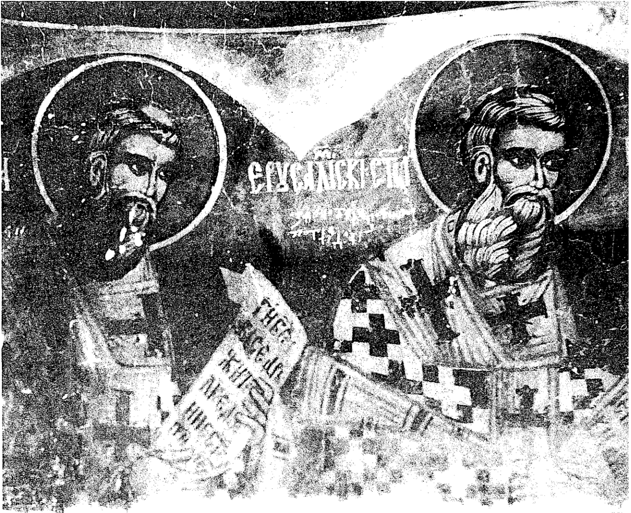
Сл. 5 Св. Сава Јерусалимски и св. Григорије (БОГО-слов?). олтар цркве Светог Мине у селу Штава, 1633. или 1636.