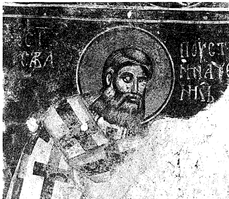
Сл. 4 Св. Сава Пустињеначелник (Јерусалимски), олтарски простор параклиса св. Гсргија, манастир Сопоћани, последње деценије XIII века.

Богослужење се крајем V и почетком VI столећа врло неуједначено обављало у појединим монашким заједницама Палестине. Свети Сава Јерусалимски је установио свеноћна бденија, која нису постојала у другим лаврама. 52 Ако се изузме заједница светог Герасима, који је средином V века увео причешће суботом и недељом 53 , остале монашке заједнице то нису чиниле, осим оних окупљених око светог Саве Јерусалимског. 54 У овим богослужбеним обредима свети Сава Јерусалимски је лично учествовао, јер је 490. године, због манастирских потреба, био посвећен за