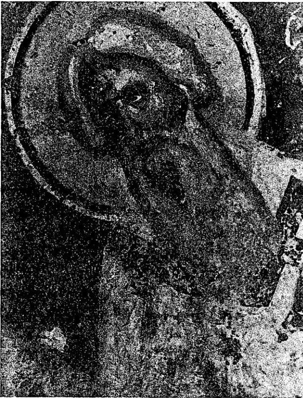
Сл. 3 Свети Сава Српски, црква Светих апостола, проскомидија, Пењка патријаршија, 1271/1272.