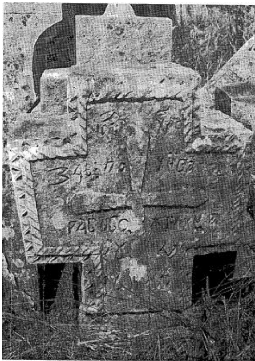
Сл. 6. Сѣоменик Луке Кучке из 1810. г.