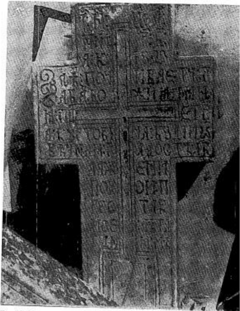
Сл. 12. Сѣомениѣ Пеѣтра Курѣѣовиѣа из 1832. г.