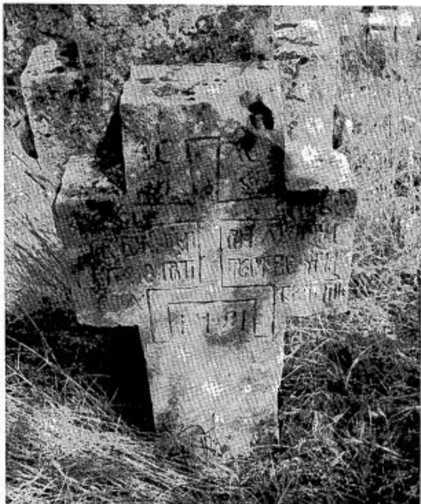
Сл. 2. Споменик Марије Лазинице из 1751. г.