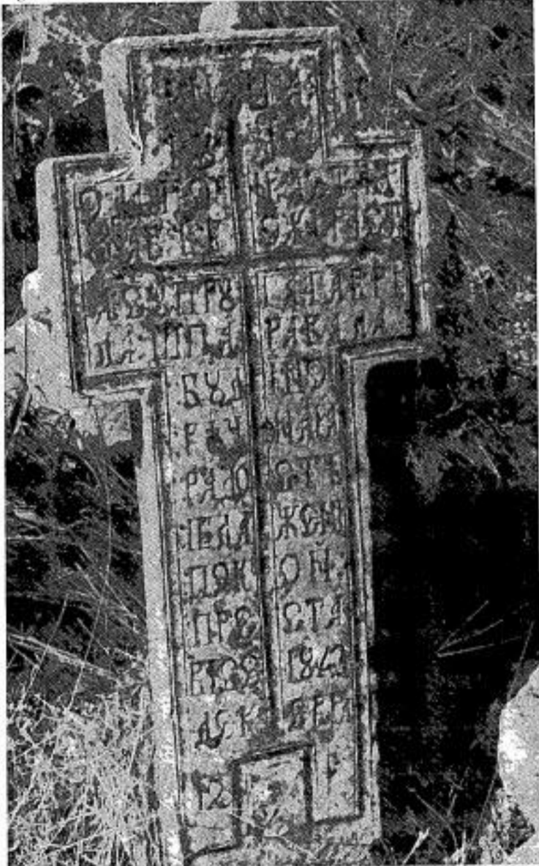
Сл. 15. Споменик Ристѣ суйрузе Гаврила Шаравала из 1843. г. Fig. 15. Monument à Rista, épouse de Gavriilo Šparavalo, datan de 1843