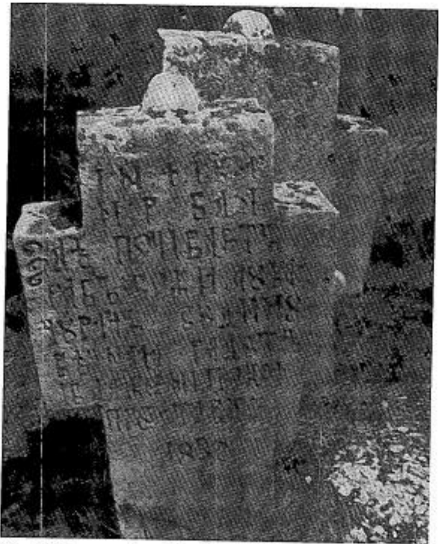
Сл. 8. Сѣоменик Луке Бѣрића из 1832. г.

Fig. 8. Monument à Luka Djurić datant de 1832