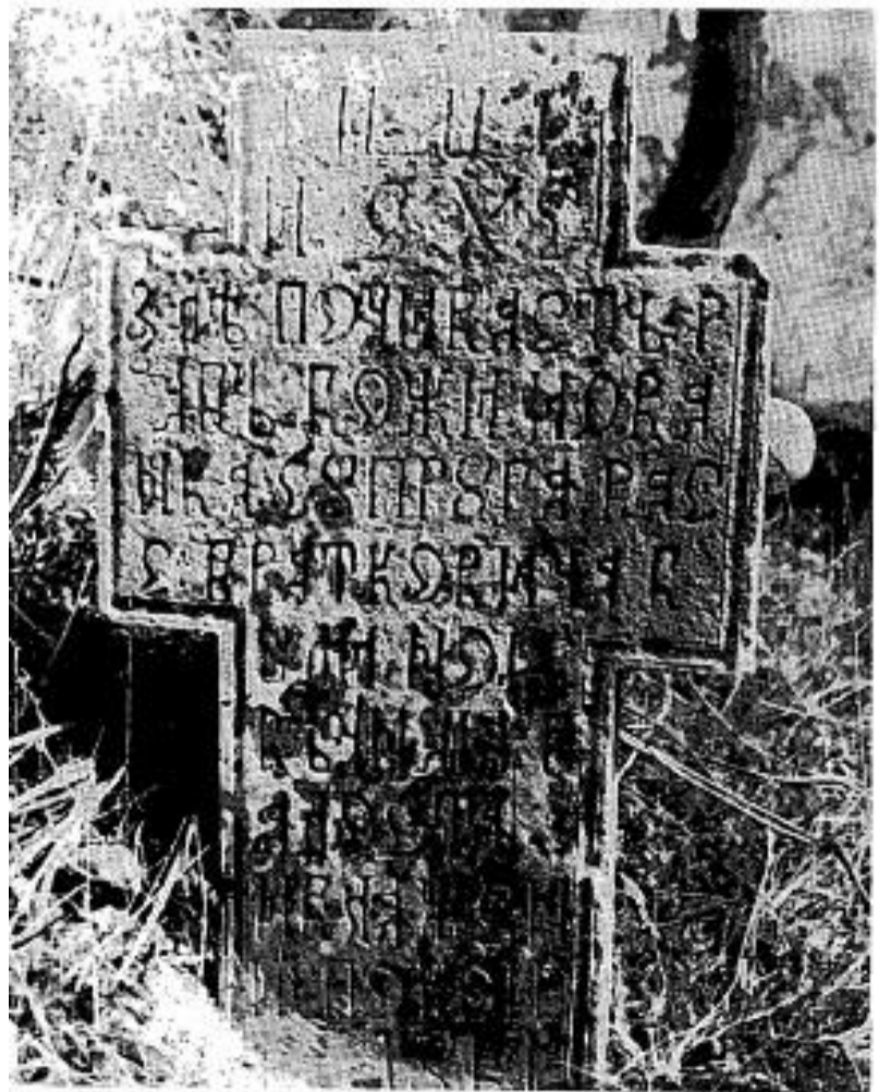
Л. 11. Сѣоменик Јованке сѣйруге Васѣ Брайтѣковића из 1861. г.

Fig. 10. Monument à Petar Kurtović datant de 1831