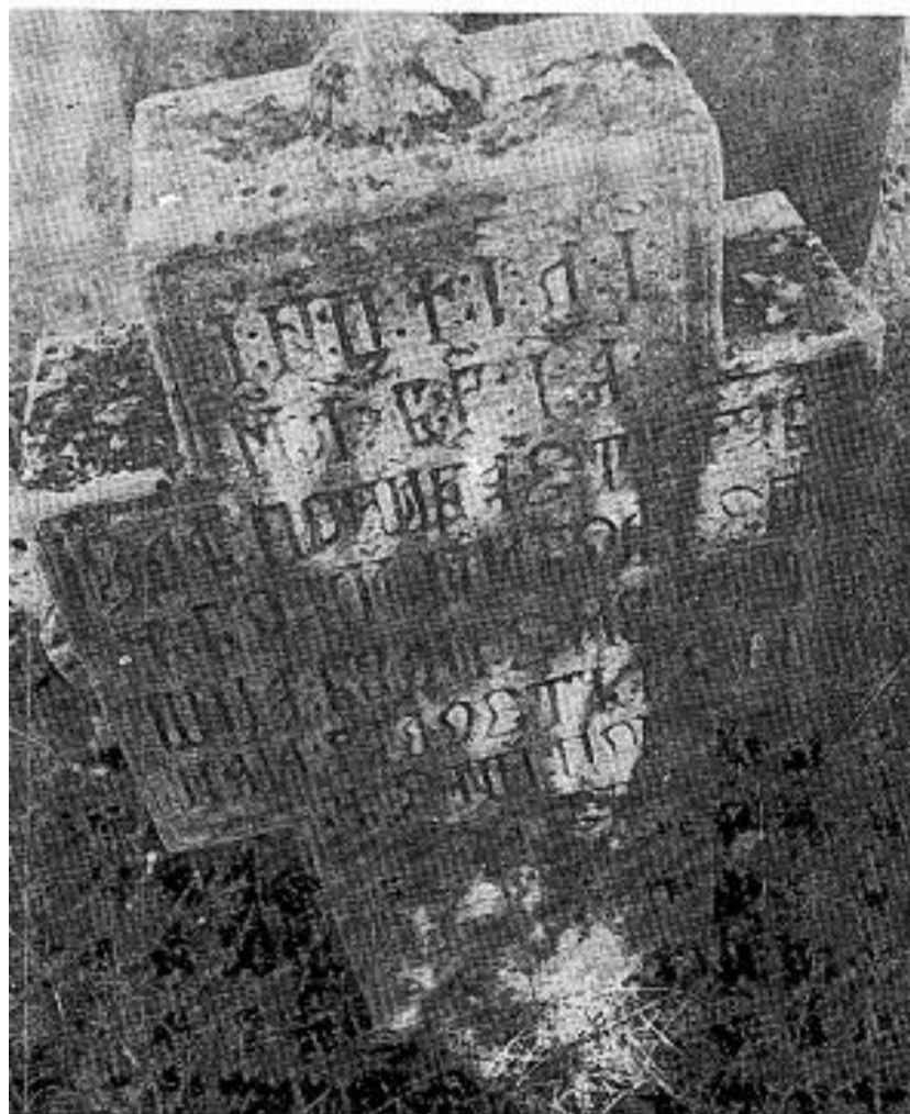
Сл. 7. Сѣоменик Николе Сѣишица, почетѣшак XIX века