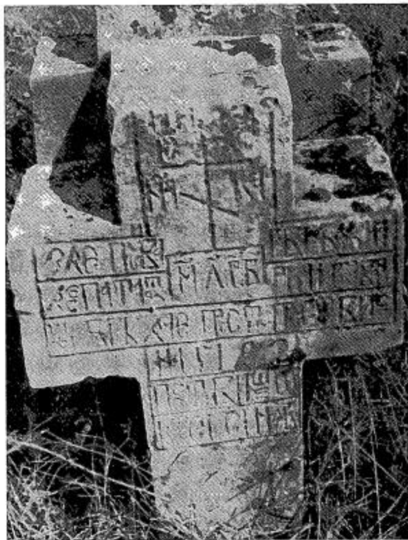
Сл. 3. Споменик Десѣе Таџаринове кћи, XVIII век