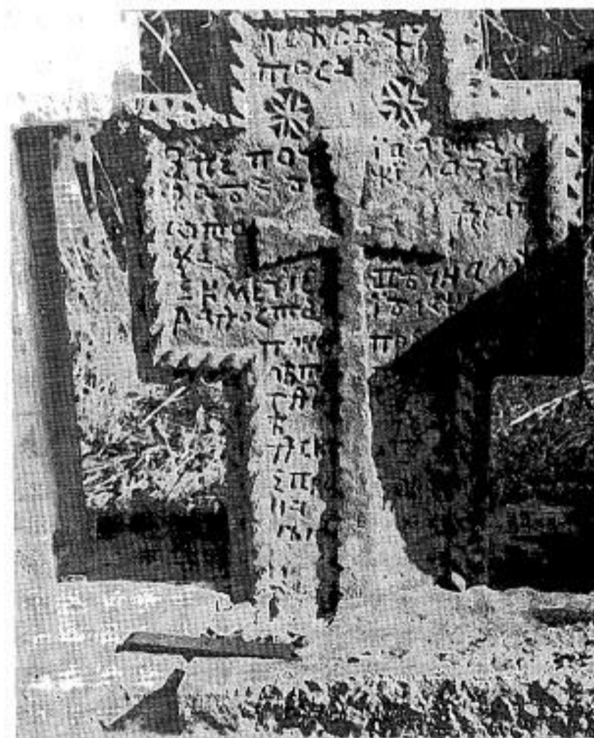
Сл. 5. Споменик Драга Екмѣије из 1810. г.

Fig. 4. Monuments de la sépulture familiale des Tošić, XVIII–XIX e siècles