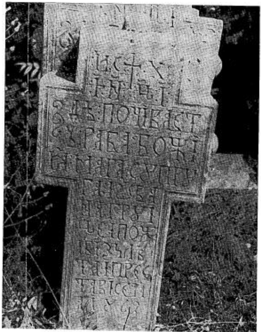
Сл. 9. Сѣоменик Марѣ сѣѣругѣ Јована Грујице из 1862. г.

Fig. 8. Monument à Luka Djurić datant de 1832