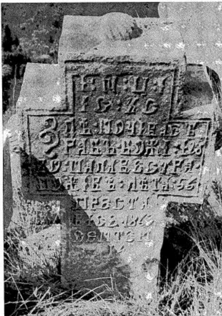
Сл. 19. Споменик Јова Палавестре из 1863. г.