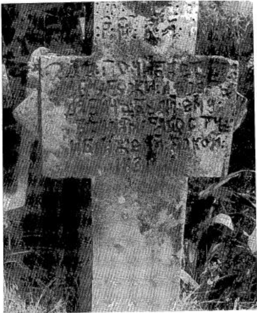
Сл. 18. Споменик Лазара Дабича из 1831. г.