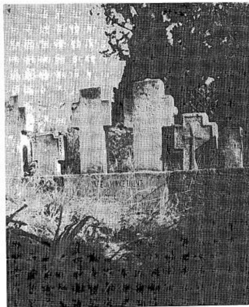
Сл. 4. Споменаци у ѣородиѣној ѣарѣели Тошѣи, XVIII–XIX век

Fig. 4. Monuments de la sépulture familiale des Tošić, XVIII–XIX e siècles