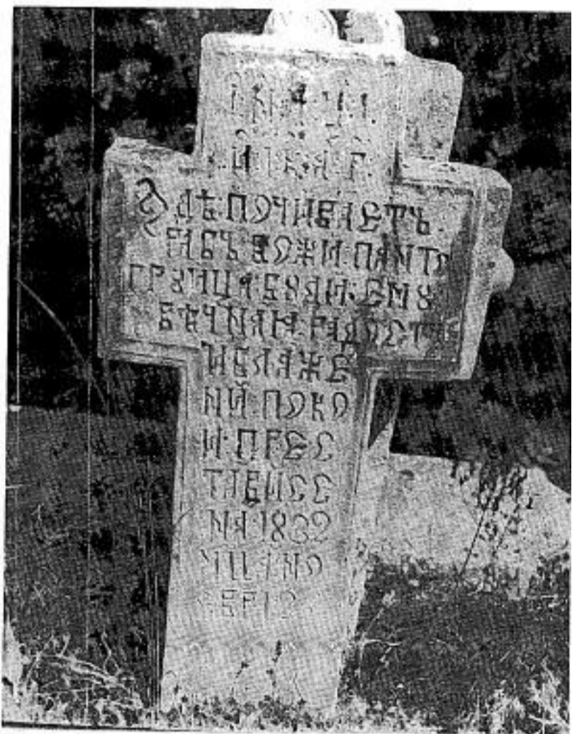
Сл. 13. Сѣомениѣ Панѣа Грујиѣа из 1832. г.