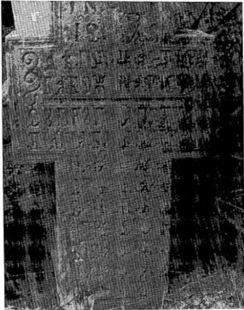
Сл. 14. Споменик Ристѣ суйрузе Петѣра Билића из 1849. г. Fig. 14. Monument à Rista, épouse de Petar Bilić, datant de 1840