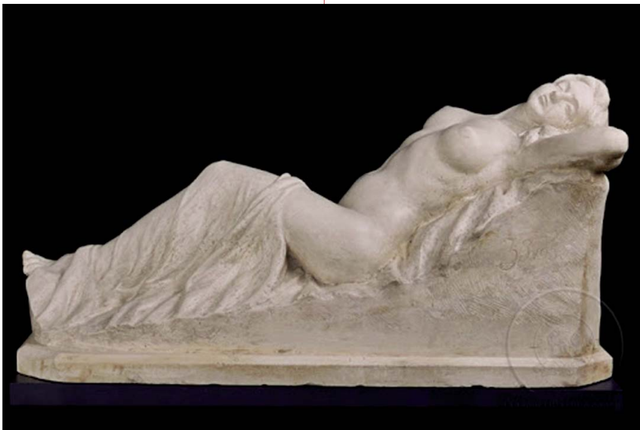
3. Ђорђе Јовановић, Одмор , мермер, 1930

We could not conclude which motif has been represented from the mere titles of these pieces, without any advance knowledge or a photograph that would show their appearance, except in the case of the Dancer and possibly Repose . The titles make us think that these are representations of still life or landscape, such as the pieces by Albert Moore Azal-