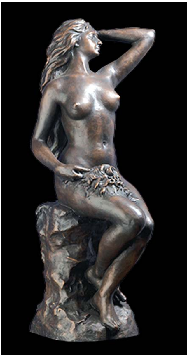
1. Ђорђе Јовановић, Мирис ђролећа, бронза, 1902