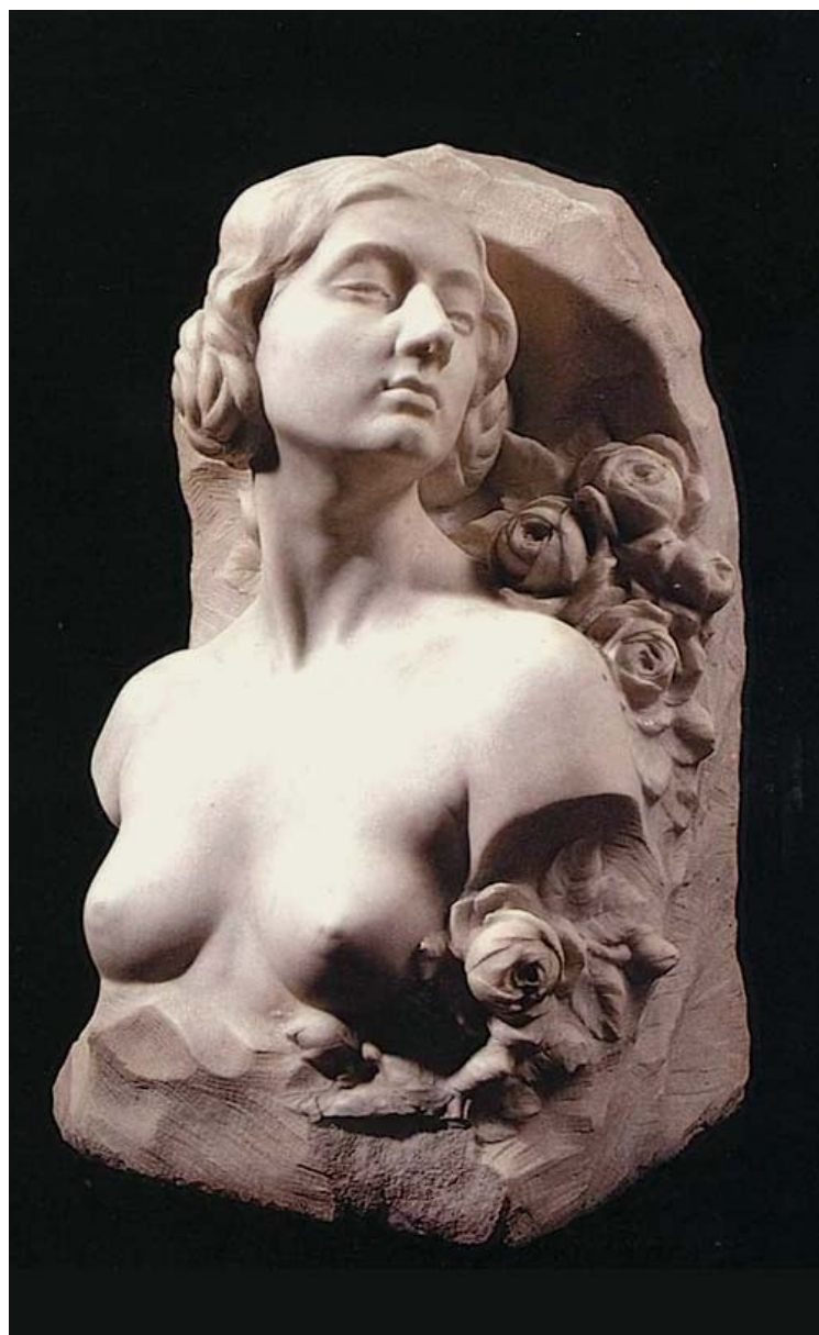
2. Ђорђе Јовановић, Мирис ружа, мермер, 1914