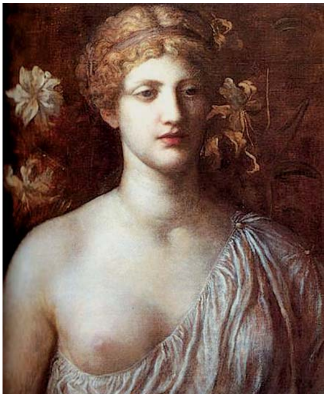
4. George Watts, Пигмалионова жена, уље на илајину , 1868