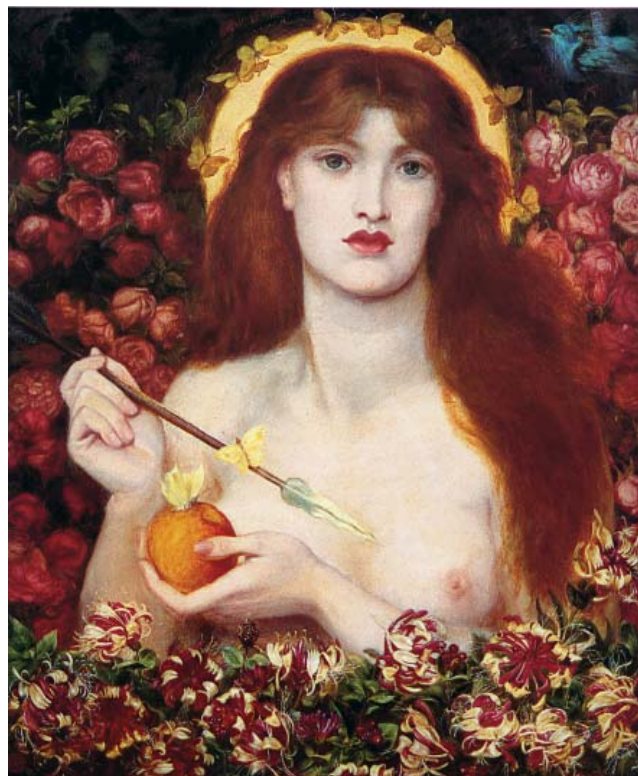
7. Dante Gabriel Rossetti, Venus Verticordia , уље на њлајну, 1863–1868.