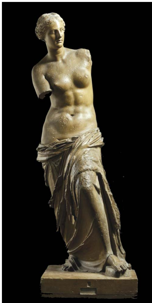
5. Venus de Milo , мермер, око 100. п. н. е.