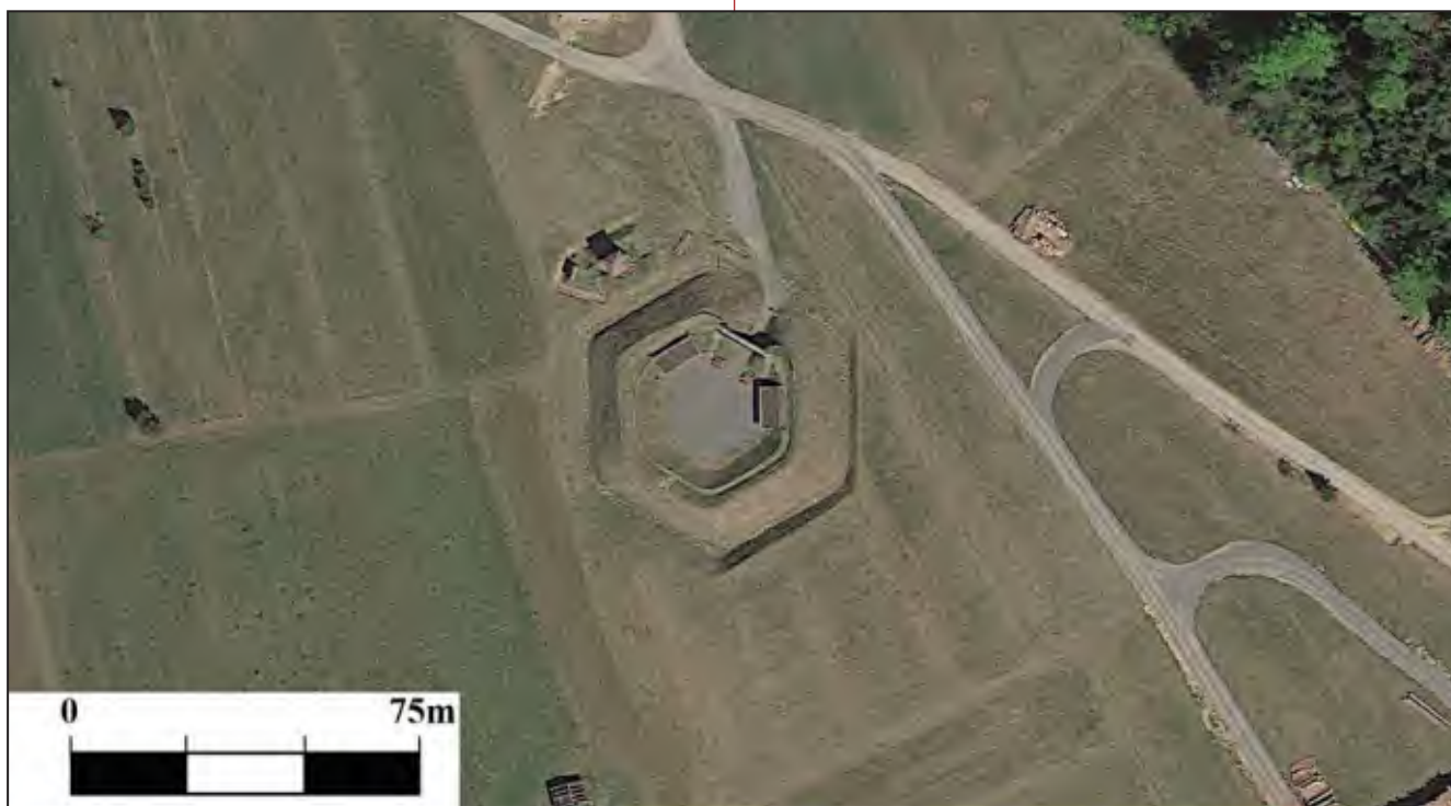
4. Сателитски снимак реконструисаног шанца у Герсбаху