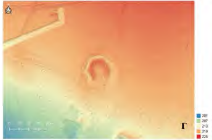
2. LiDAR снимци локалитетa Коњско гробље: а) DTM снимак локалитетa без вегетације; б) ортофотографија; в) снимак са изохијама на еквидистанци од 1 m и г) снимак са класификацијом висина по бојама