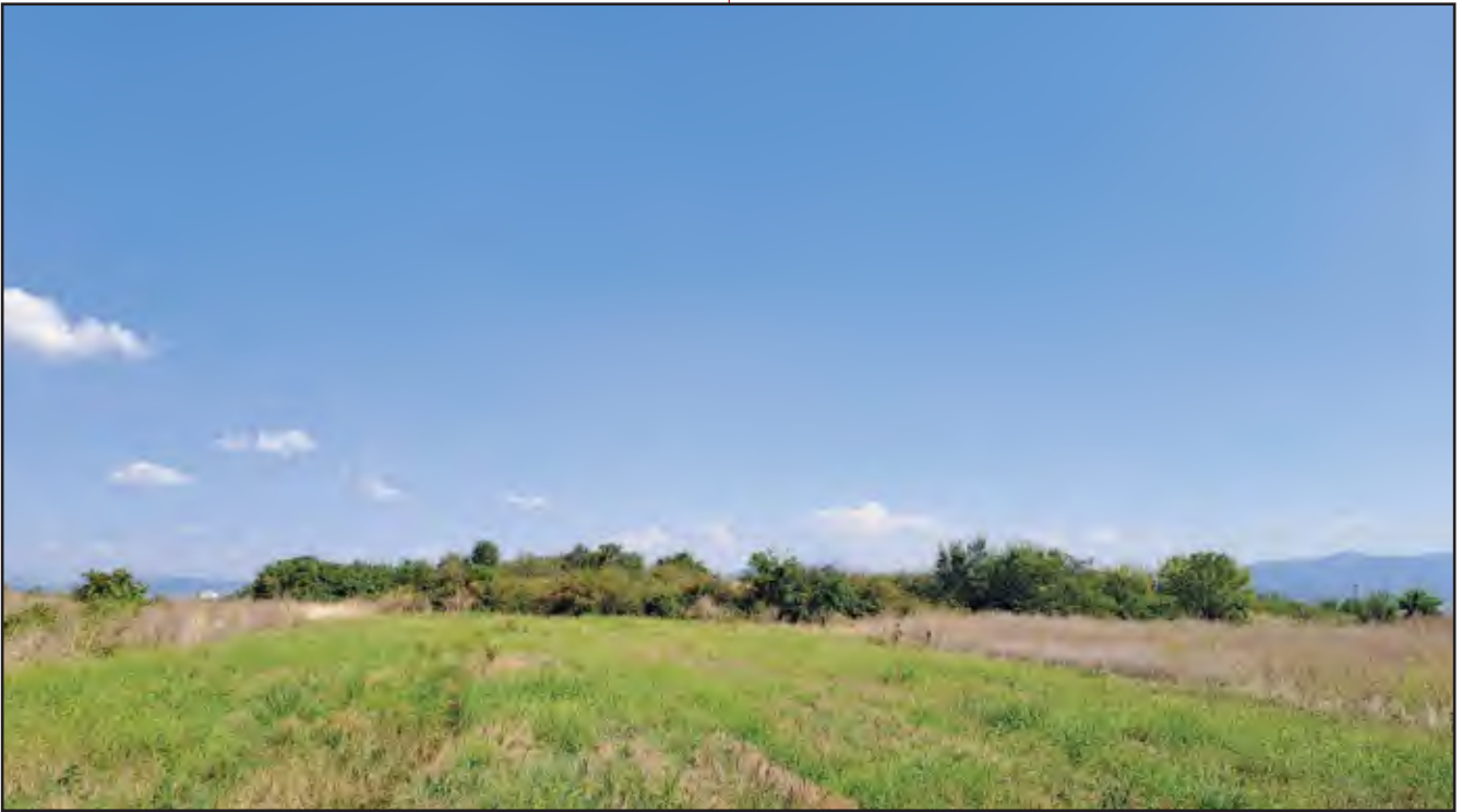
1. Изглед локалитета Коњско гробље са северозападне стране, август 2023, фото Ј. Бозић