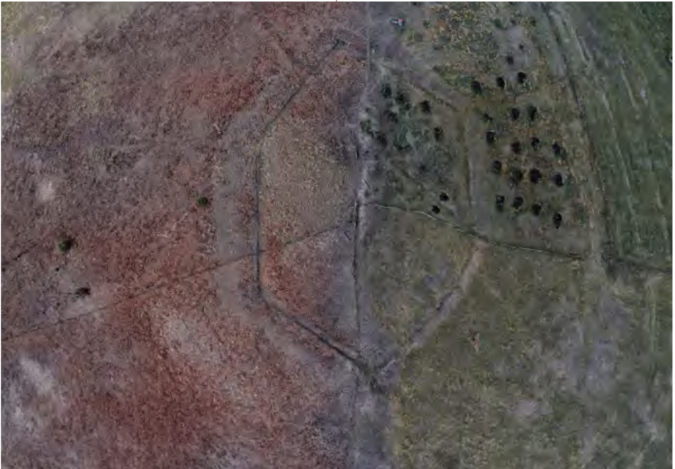
3. Снимак из дрона, „Карађорђевог шанца“ у Кремнима