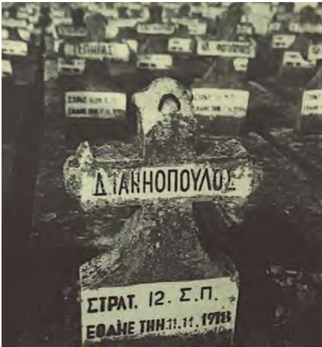
4. Крст на Грчком војничком гробљу, М. Соколовић 1971, РЗЗЗСК