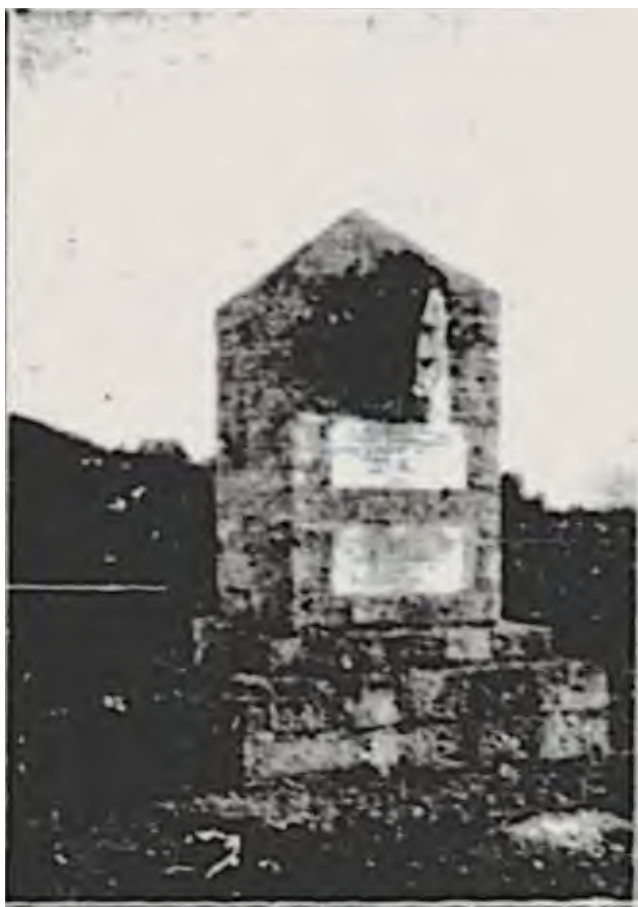
1. Стари споменик на Грчком војничком гробљу, Време , 11. 11. 1933. године