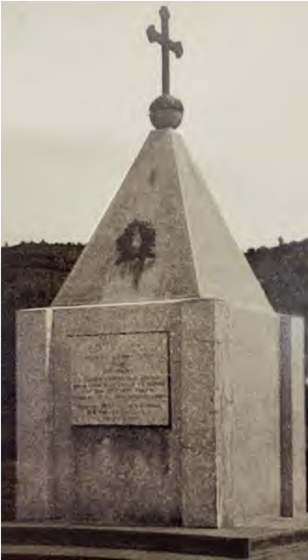
5. Српско војничко гробље, P333CK