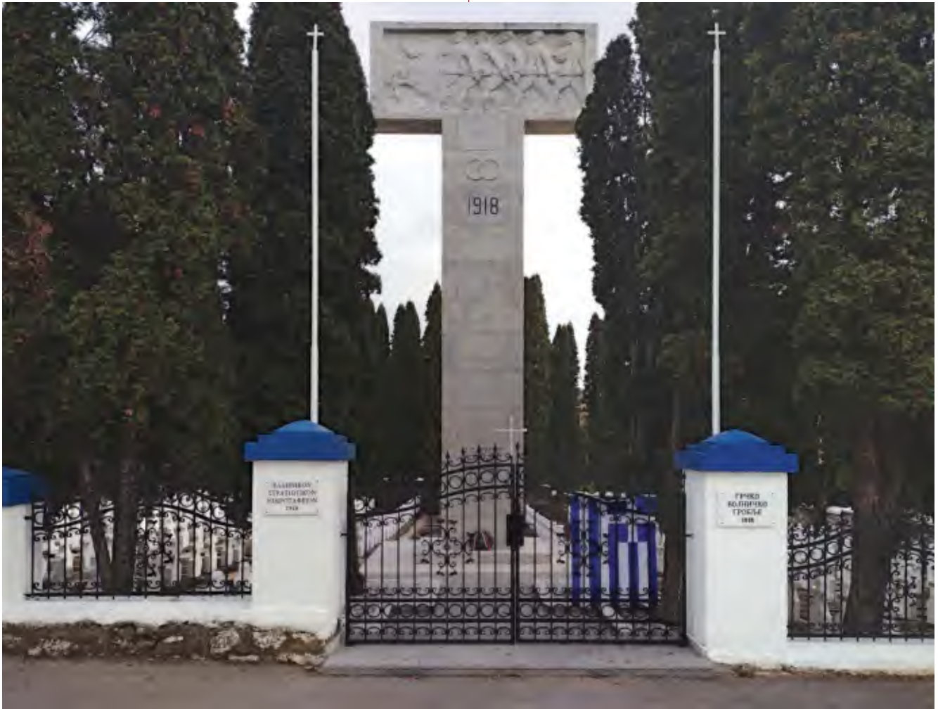
7. Грчко војничко гробље, 2022