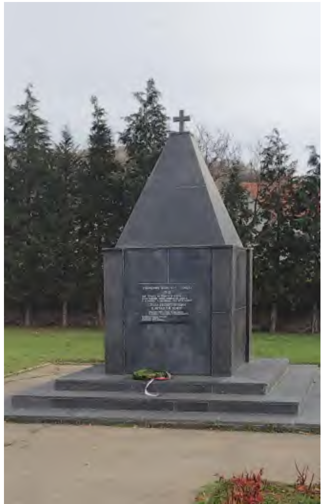
6. Српско војничко гробље, Миша Анђелковић 2022