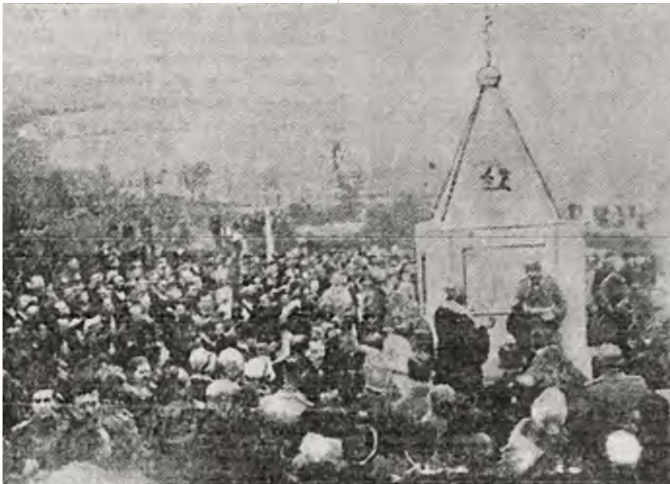
2. Освећење споменика на Српском војничком гробљу, Полићика, 26. 11. 1930. године