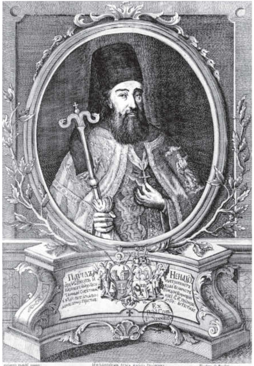
2. Теодор Крачун, Јанош Филиј Биндер, Портрети митрополија Павла Ненадовића , 1770, бакрорез, Magyar Nemzeti Múzeum, Történelmi arcképcsarnok

Врло брзо након митрополитове смрти појавили су се његови графички портрети, који су настајали из двојаких разлога: најпре, као израз поштовања и неговања јавног сећања на његову личност, али и као прилика бакроресцима за добру зараду. Око 1770. године појавио се бакрорезни портрет, који је наручио јереј Василије Протич, а за који