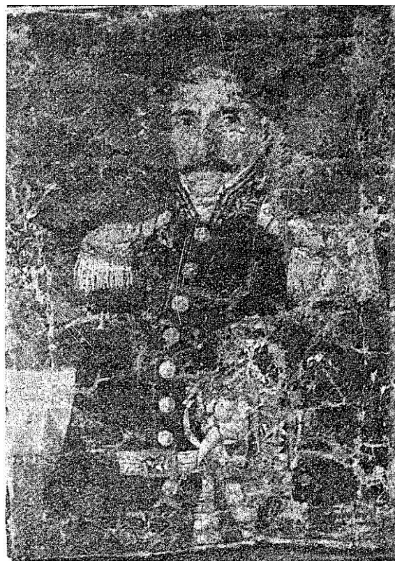
Сл. 3 — Портре Јовице Милутиновића од Георгија Бакаловића