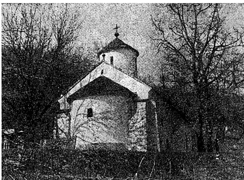
Сл. 1. — Црква св. Николе у Крчмару

Подупирање и презиђивање стубаца изводило се појединачно, како велики број греда не би ометао рад. Отпочело се са најугроженијим стубом који је био највише напукао — у олтару лево, затим се прешло на десни, а потом на предња два. Овим