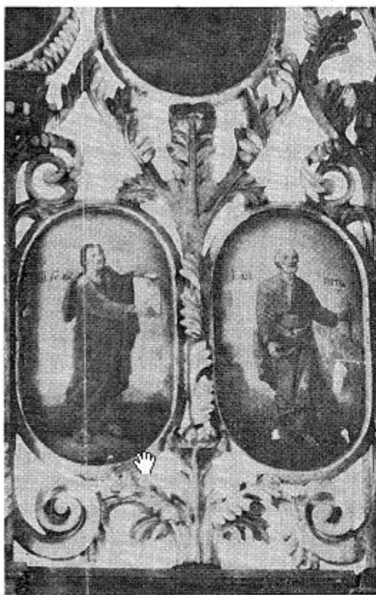
2. Бачинци, Сремска Митровица, црква св. Николе, изглед друге зоне иконостаса, апостоли, рад Константина Пантелића, 1835. 2. Bačinci, Sremska Mitrovica, église St. Nicolas, aspect de la seconde zone de l'iconostase, les apôtres, oeuvre de Konstantin Pantelić, 1835