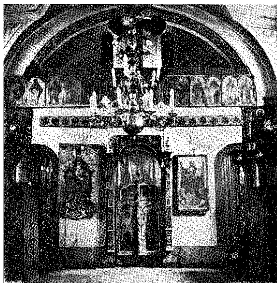
1. Шатринци (Сремска Митровица) иконостас цркве