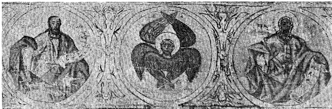
6. Шатринци (Сремска Митровица), пророци, рад Теодора Стефанова Гологлавца