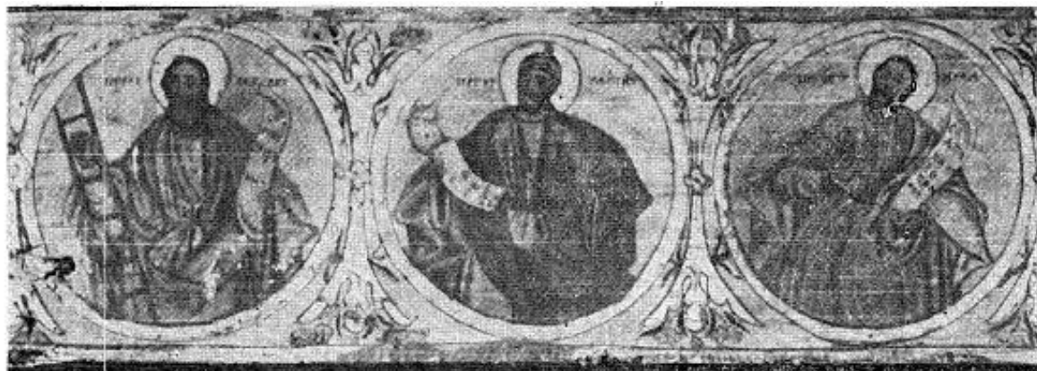
5. Шатринци (Сремска Митровица), пророци, рад Теодора Стефанова Гологлавца