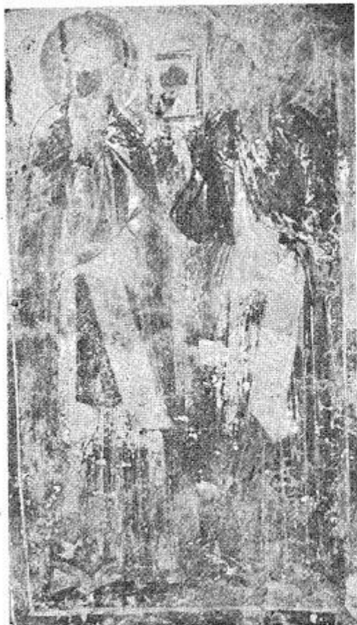
4. Манастир Горњак, црквица св. Николе, св. испосници, XV—XVI век 4. Monastère Gornjak, petite église de st. Nicolas, st. confesseurs