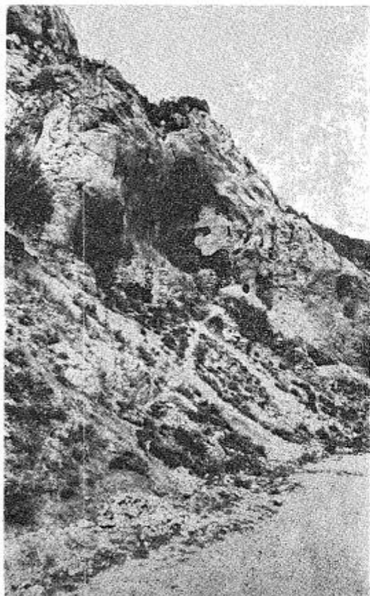
3. Монашке испоснице у Ждрелу 3. Les confessionaux des moines à Zdrela