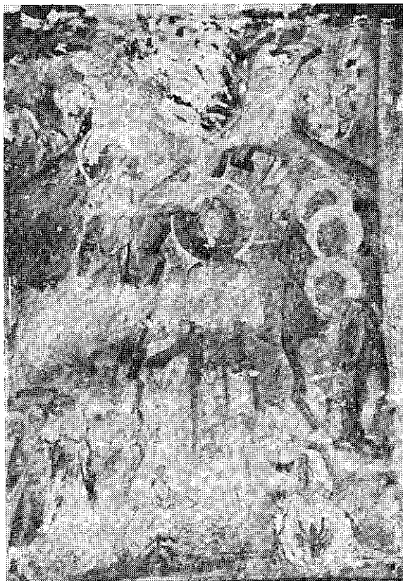
7. Манастир Горњак, црквица св. Николе, Крштење, XV—XVI век

6. Monastère Gornjak, petite église de st. Nicolas, Présentation au Temple XV—XVI ème siècle