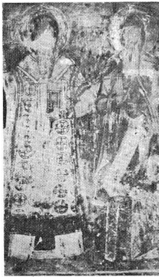
5. Манастир Горњак, црквица св. Николе, св. Сава и св. Симеон Немања, XV—XVI век 5. Monastère Gornjak, petite église de st. Nicolas, st. Sava et st. Simeon Nemanja. XV—XVIème siècle

Стефан нови, у уздигнутој десној руци држи икону Исуса Христа (сл. 4). Насликана икона представљена је са дршком при дну. На јужном зиду, одмах до западног, у приземној зони преостале су фигуре св. Саве и св. Симеона Немање (сл. 5). Остали део приземне зоне је без фресака, сасвим уништен, сем што је у олтарском простору још увек присутна избледела представа двојице архијереја чије су сигнатуре нестале.