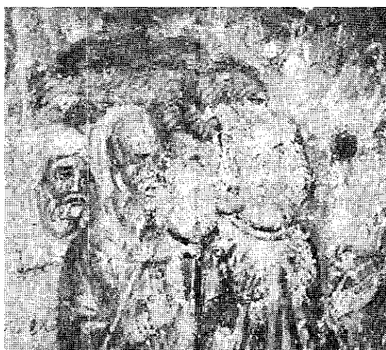
8. Манастир Горњак, црквица св. Николе, Крштење, детаљ, XV—XVI век

7. Monastère Gornjak, petite église de st. Nicolas. Le Baptême, XV—XVI ème siècle