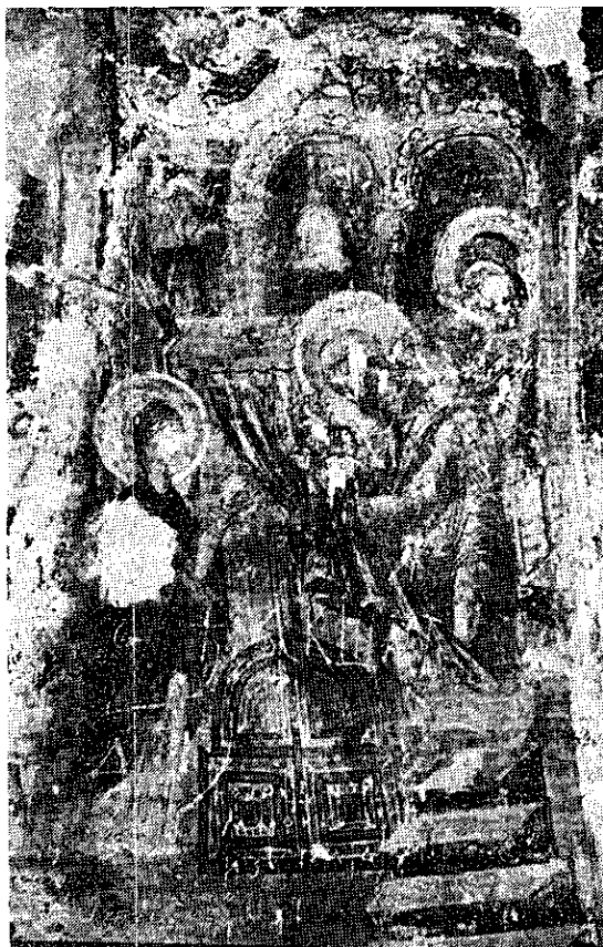
6. Манастир Горњак, црквица св. Николе, Срећење, XV—XVI век

6. Monastère Gornjak, petite église de st. Nicolas, Présentation au Temple XV—XVI ème siècle