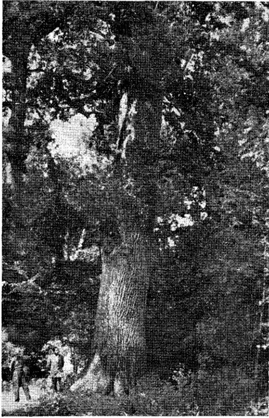
4. Вратишна: Четиристогодишњи храст — »Vratična«: Chêne âgé de quatre-cents ans.

Што се тиче грађевинског материјала који су Срби најрадије употребљавали за своје личне потребе, и ту је дрво одиграло главну улогу. 45 У XVI веку наилазио је Дерншвам на веома скромне кућице. 46