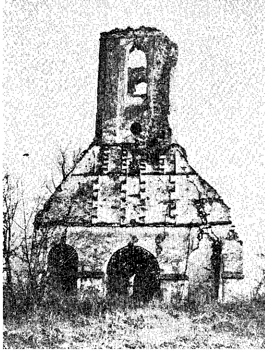
1. Црква у Поречу, код Доњег Милановца, западна страна