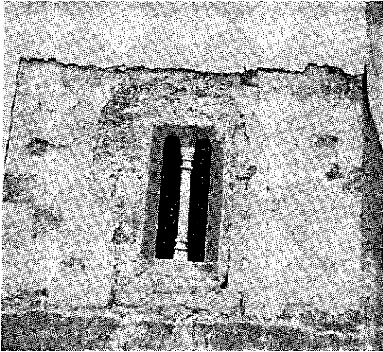
1. Деталј новооткривене фреско-декорације на фасадама цркве манастира Бање