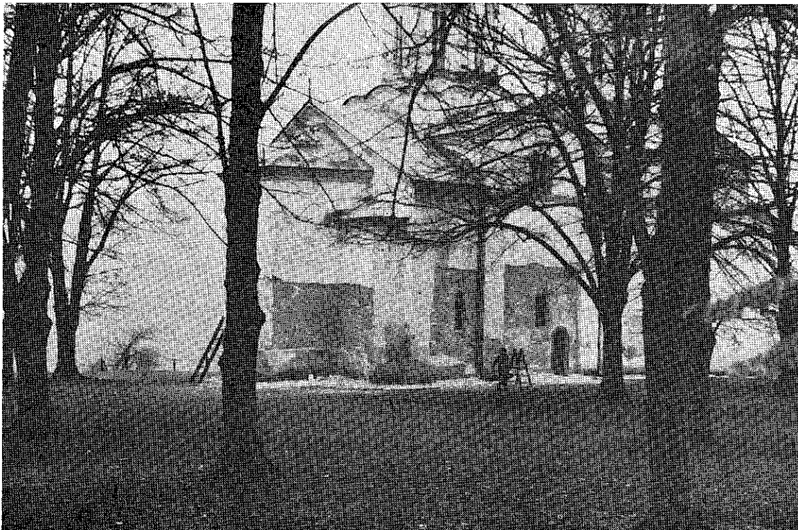
4. Манастир Бања у току радова