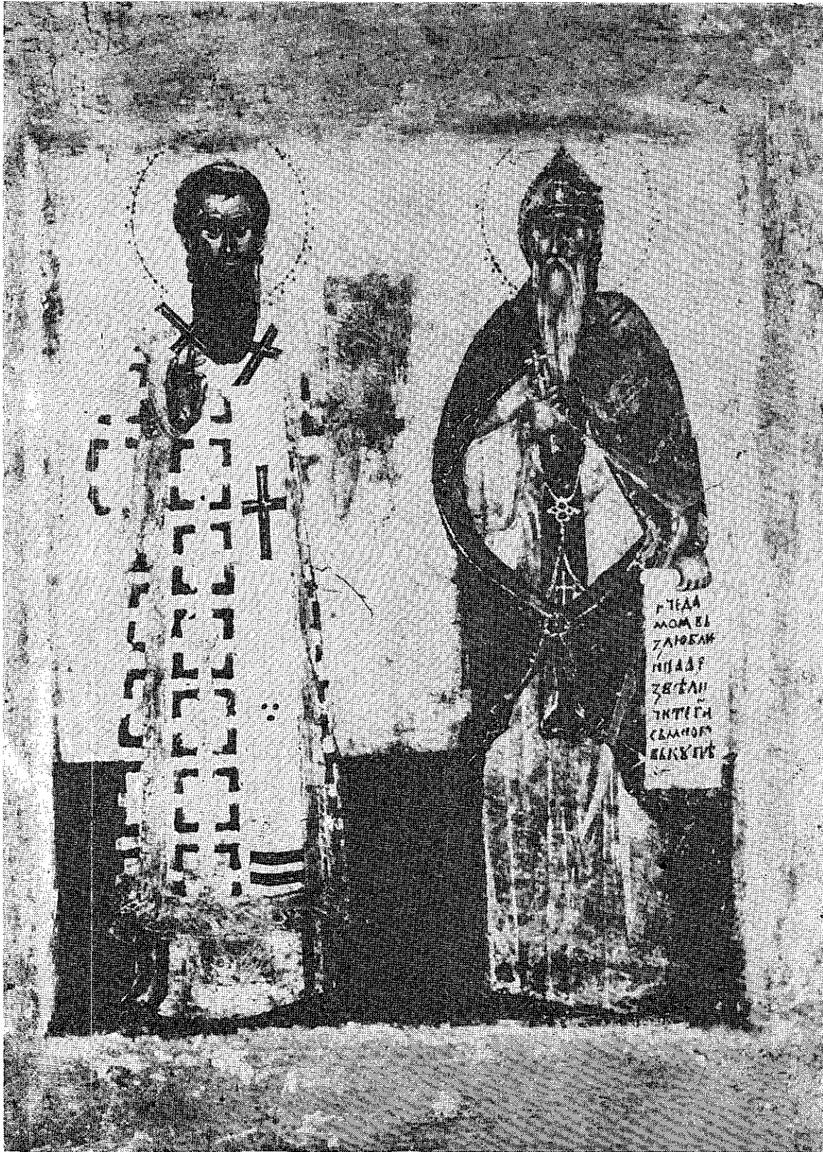
1. Икона св. Саве и св. Симеона Немање у Народном музеју у Београду