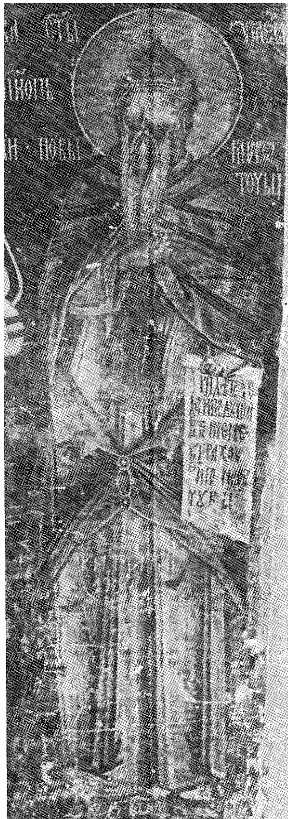
2. Икона св. Саве и св. Симеона Немање у Народном музеју у Београду, св. Симеон Немања (деталј) 2. Icône: St. Sava et St. Siméon Nemanja, au Musée national de Beograd (détail)