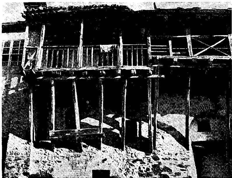
Сл. 2. Тремови на коначима манастира Хиландара.