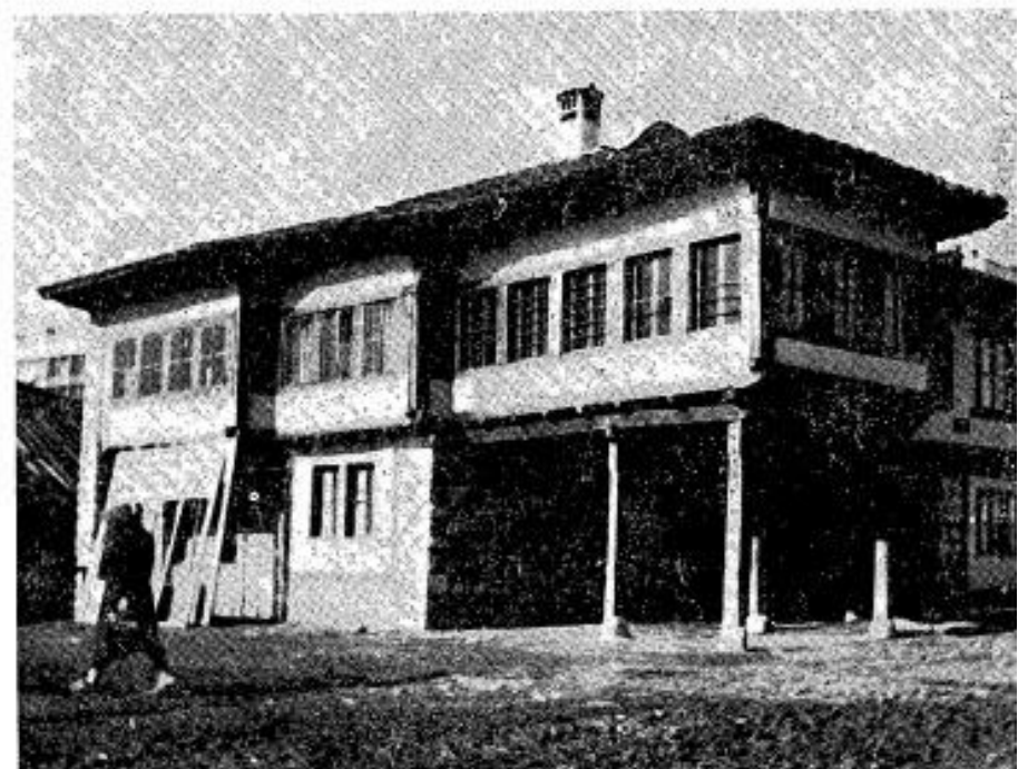
Сл. 8. Тахир-бегов конак у Пећи, пре и после преношења на ново место.