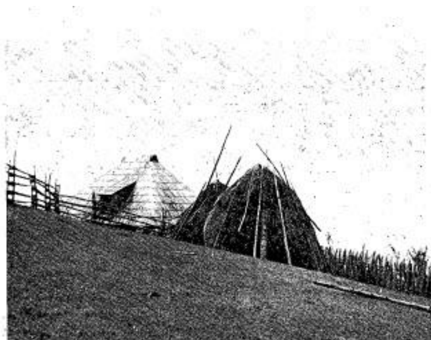
Fig. 5. «Košara», (hutte tressée pour garder le maïs), Montagne Zlatar. L'édifice a été construit avant quelques années. Il est quand même construit de la même façon dont on construisait les «brvnare» dans un passé lointain.