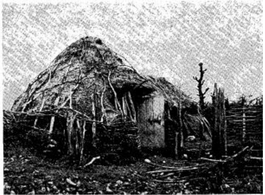
Сл. 4. Појата са планине Ртња очуван пример сасвим архаичног грађења људских станишта. Заштита у изворном и непромењеном облику готово да и није могућа, јер је грађена од трошног материјала чије пропадање није могуће зауставити. Једини начин да се споменик сачува је снимање и прикупљање других података.

Fig. 4. «Pojata» Cabane dans la montagne Rtna, exemplaire conservé de construction tout à fait archaïque de maison (habitat). Protection dans sa forme authentique et inchangée n'est presque pas possible, car il est construit dans un matériau qui s'effrite dont la ruine et la destruction ne peut être arrêtée. Le seul moyen de garder ce monument est de le photographier et de réunir d'autres données.