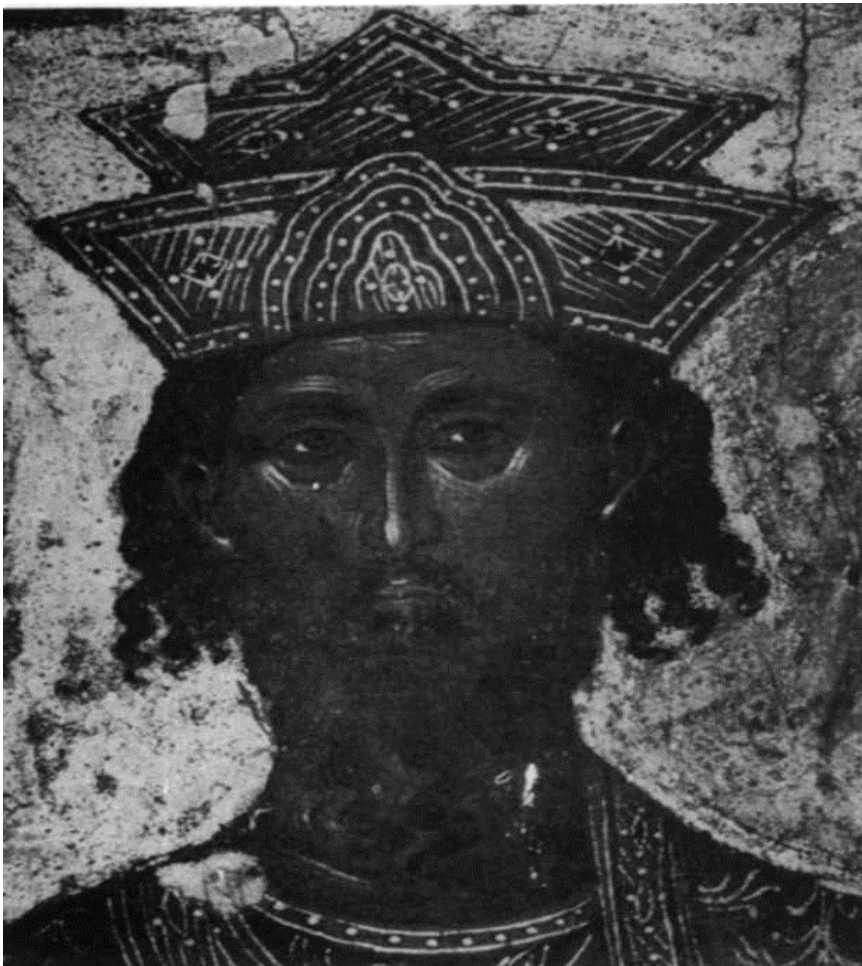
Сл. 3. Св. Јаков Персијанац (детал) / Fig. 3. Saint Jacob le Perse (détail)

говаца из Далмације и Венеције са славонским Србима. Сачувани су до данас поједини поклони српских трговаца који су у повратку из приморских градова даровали неке цркве и манастире у Славонији.