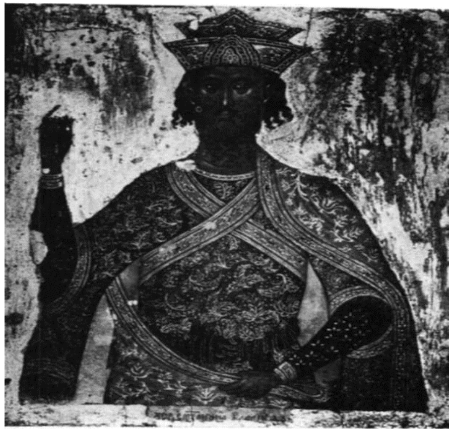
Сл. 2. Св. Јаков Персијанац Fig. 2. Saint Jacob le Perse

Иако не знамо годину рођења Емануила Ламбардоса, његова делатност припада крају XVI