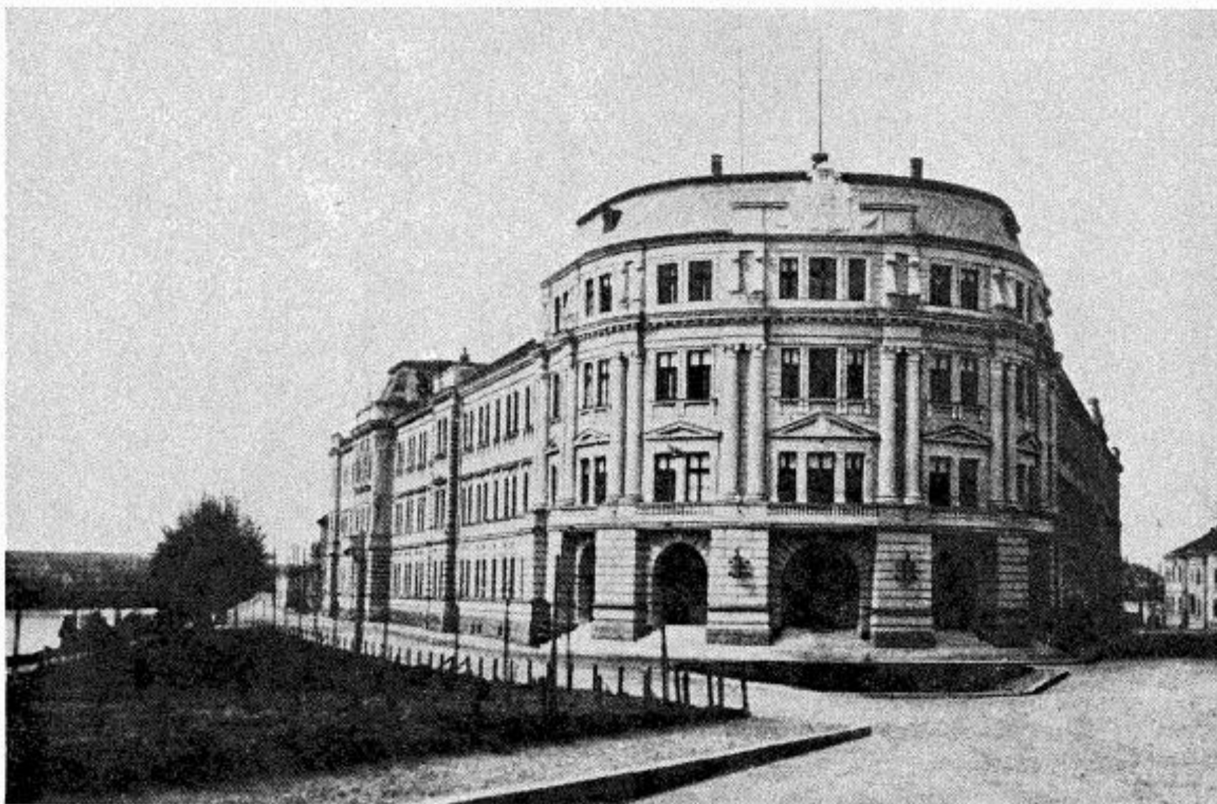
Сл. 3. Изглед зграде из времена пред други светски рат, са погледом на у то време решен фронтални анекс са трга заједно са улазном партијом