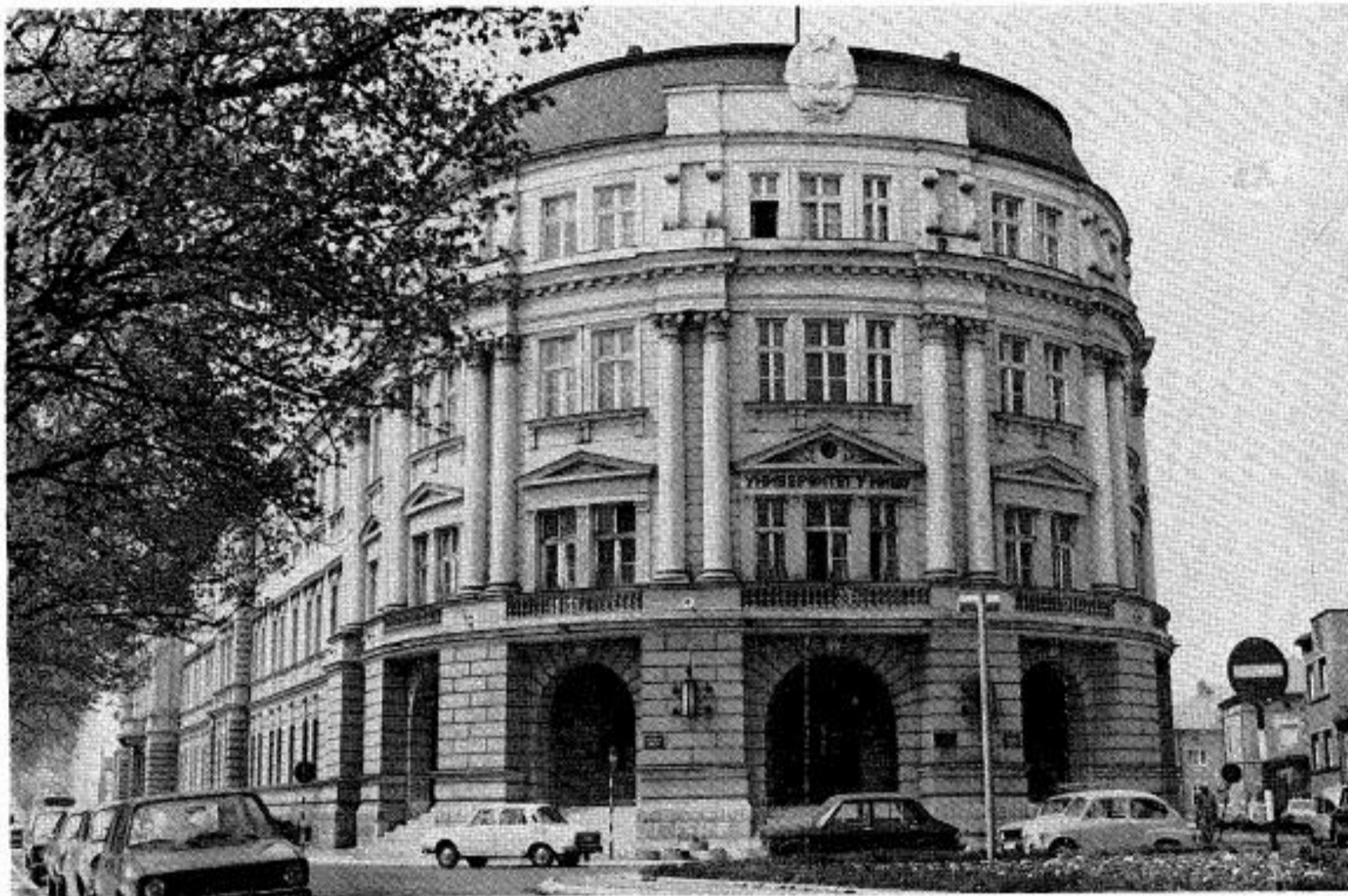
Сл. 5. Изглед зграде са погледом у истом правцу из времена после изведених радова на реставрацији фасадних површина, колористички достојно третираних, односно презентованих.