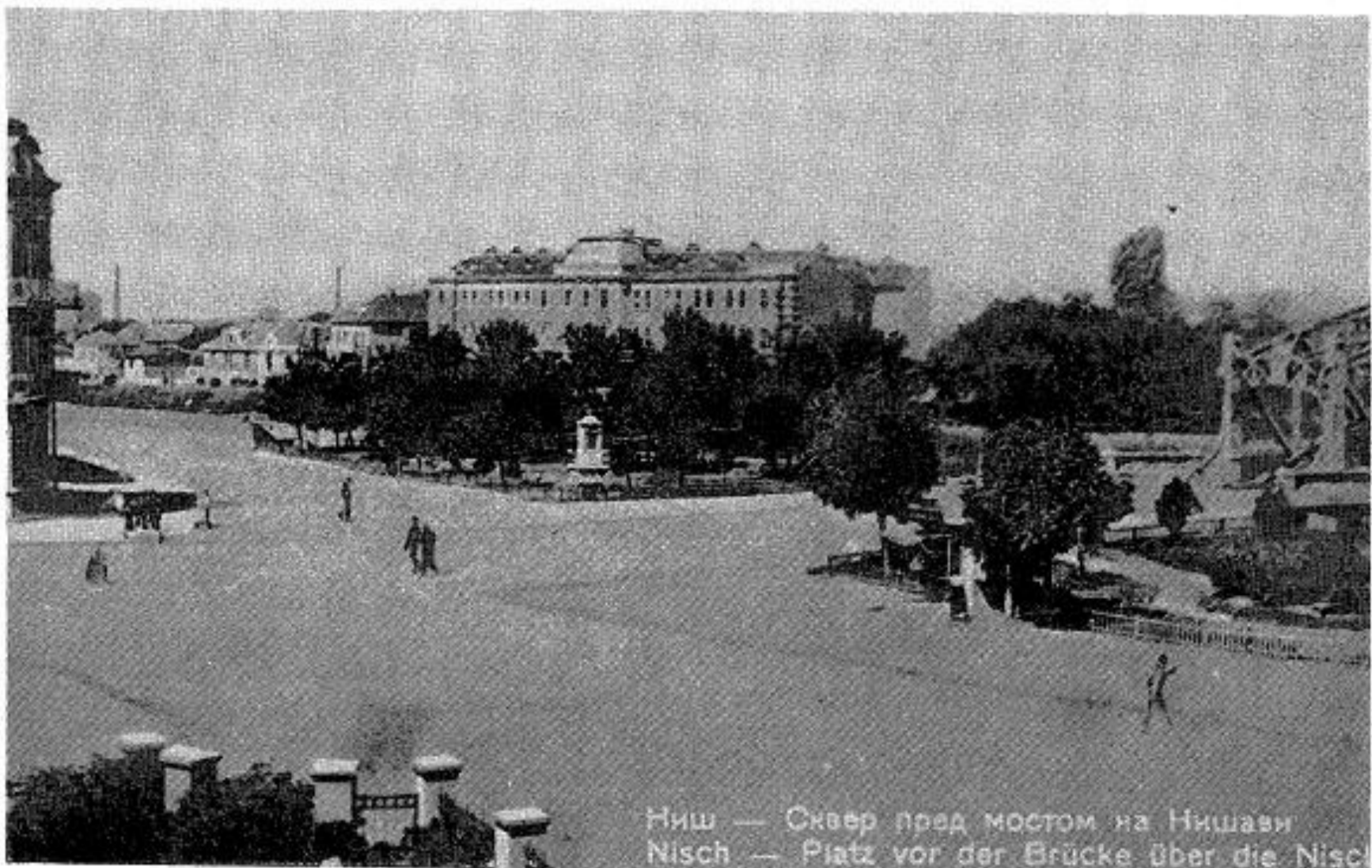
Fig. 2. Édifice après 1925, agrandi d'un étage. Vue depuis la place centrale de la ville.