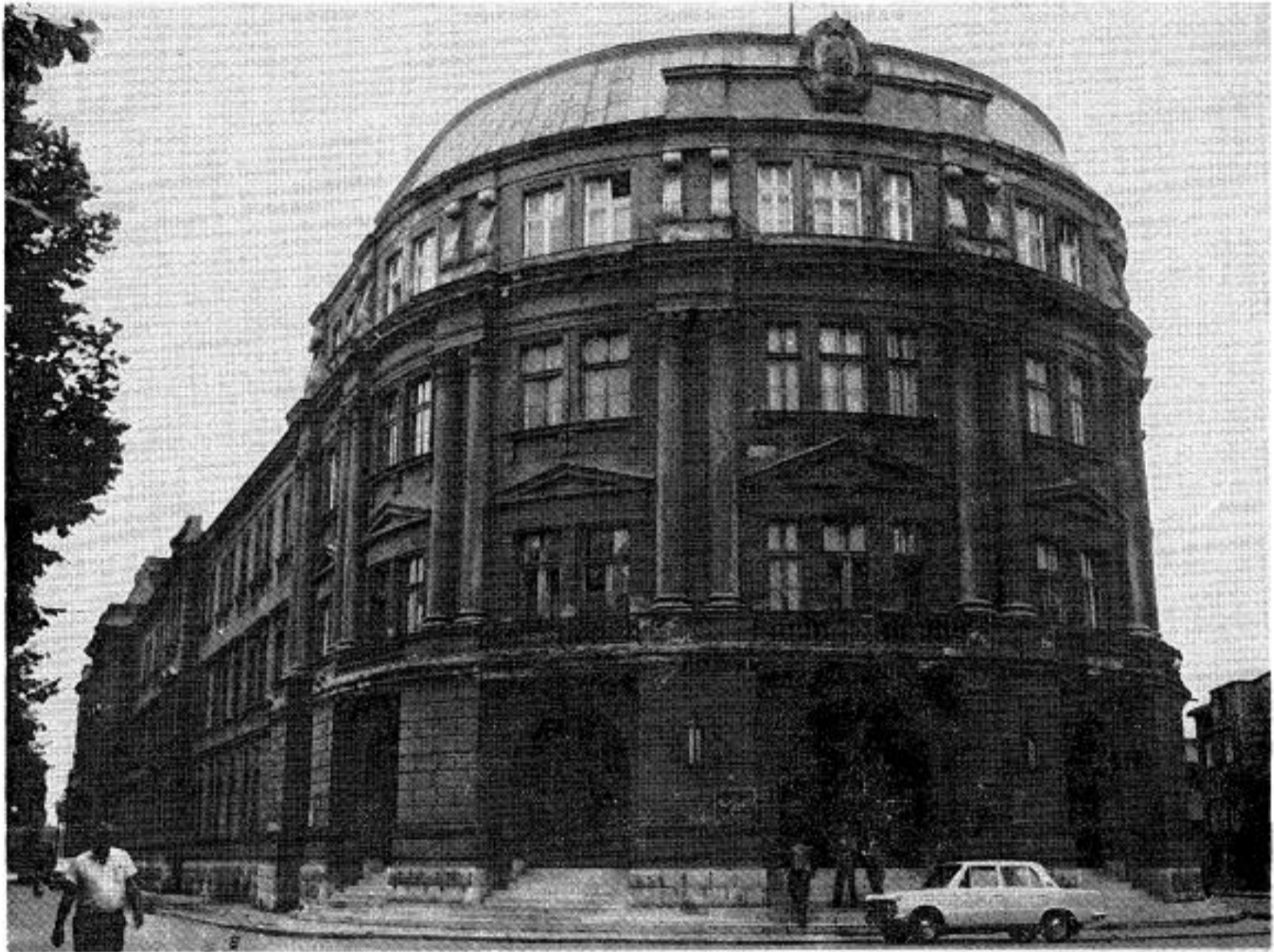
Сл. 4. Изглед зграде са погледом у истом правцу из времена пре почетка конзерваторско-рестаураторских радова од 1976. год.