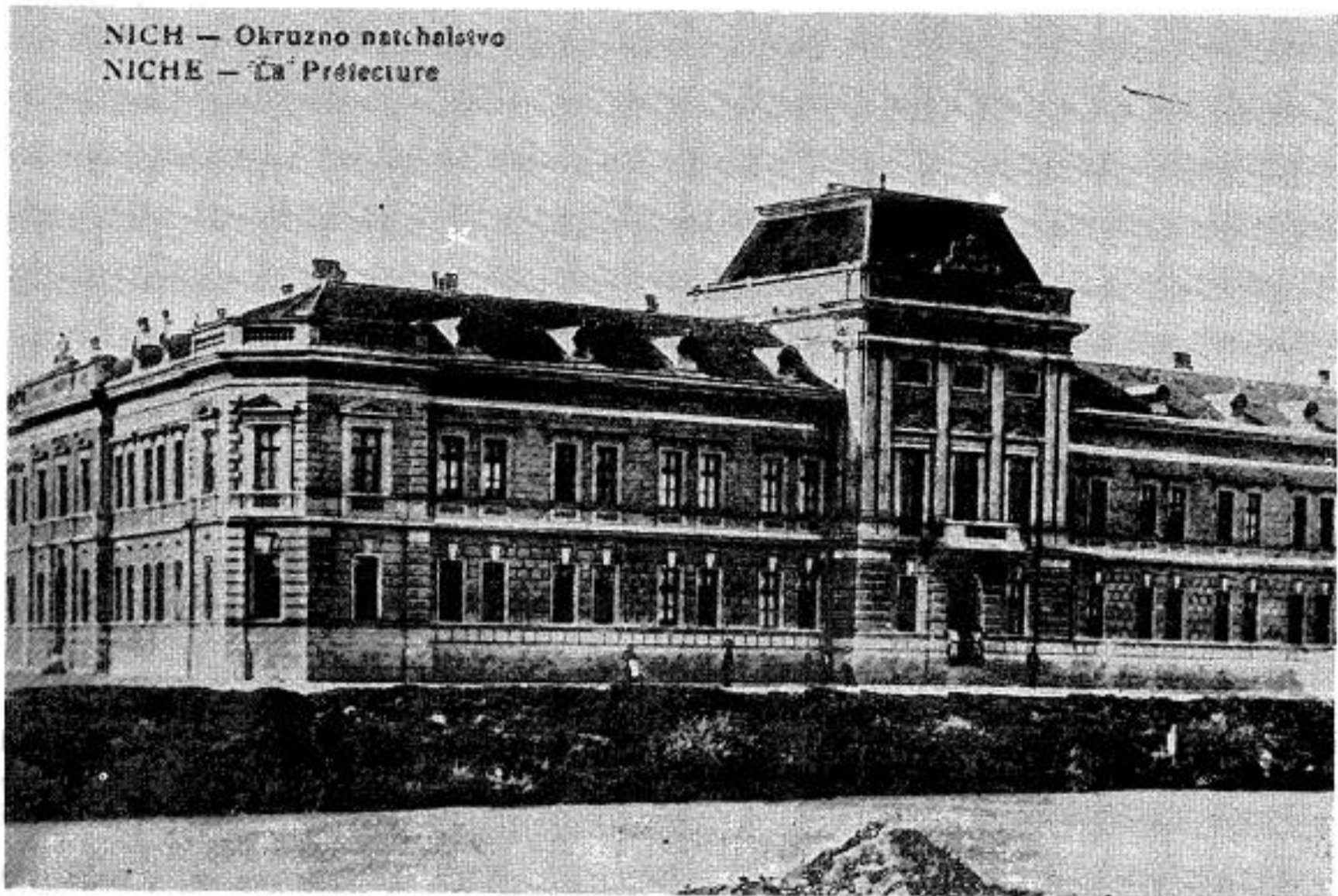
Сл. 1. Изглед зграде из времена њеног првобитног облика и састава.