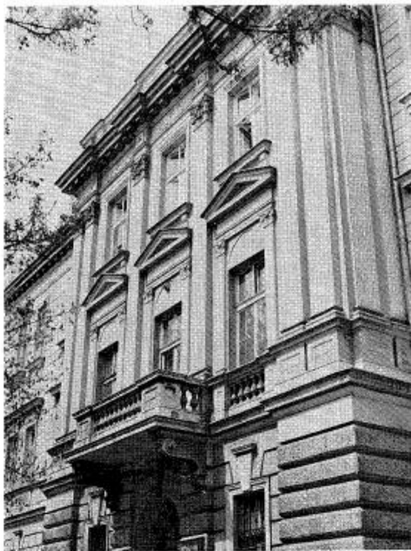
Сл. 6. Поглед на средиште зграде Fig. 6. Partie centrale de l'édifice.

Они су били једноставнији у односу на радове на фасадама са улице. Замењена је свуда дотрајала пратећа лимарија и извршена завршна обрада фасадних површина.