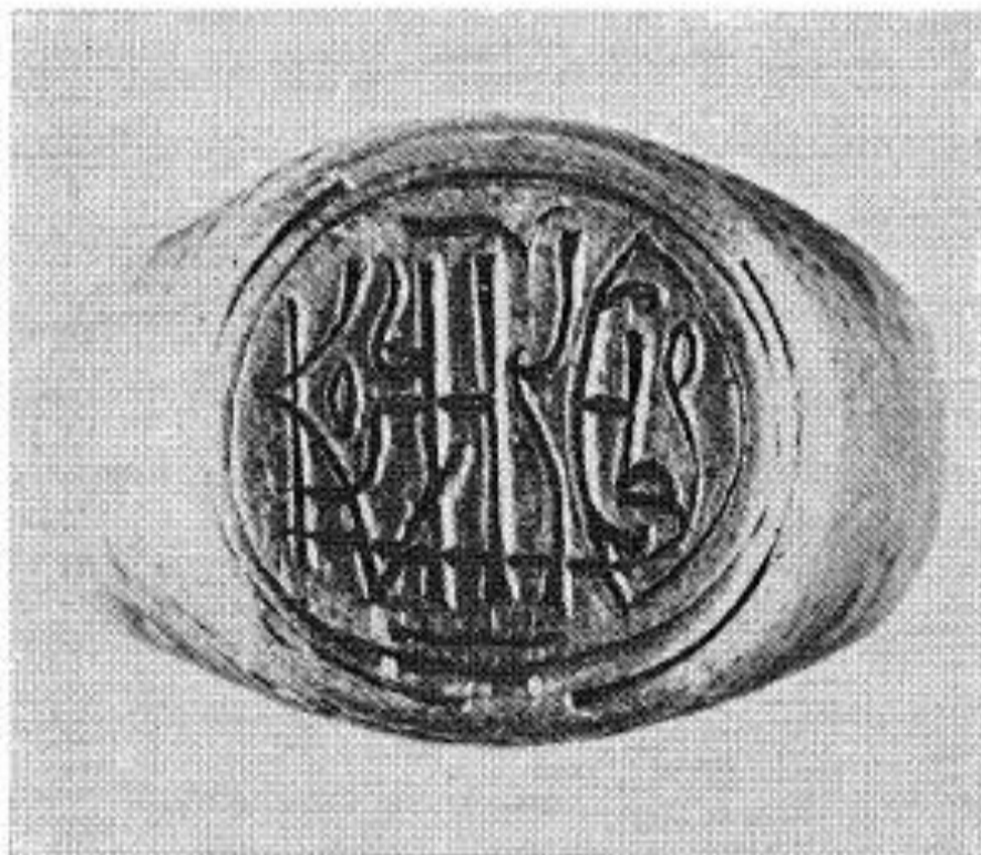
Сл. 4. Детаљ печатњака прстена са складно укомпонованим именом и презименом његовог власника