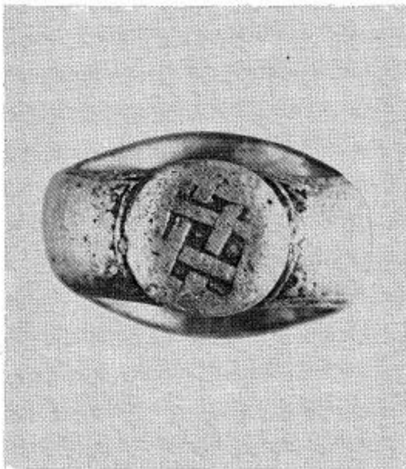
Сл. 3. Доњи, проширени део прстена са откривеним украсом у виду крајње једноставног преплета