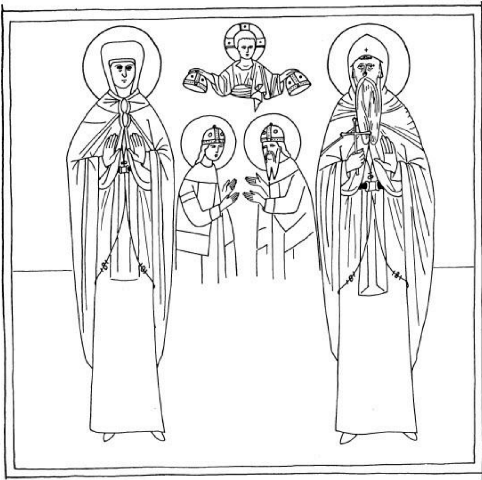
Сл. 2. Краљица Јелена и краљ Урош као монаси и инвеститура Константина и краља Милутина (реконструкција), Грачаница, 1318—1321 (цртеж Б. Живковић)