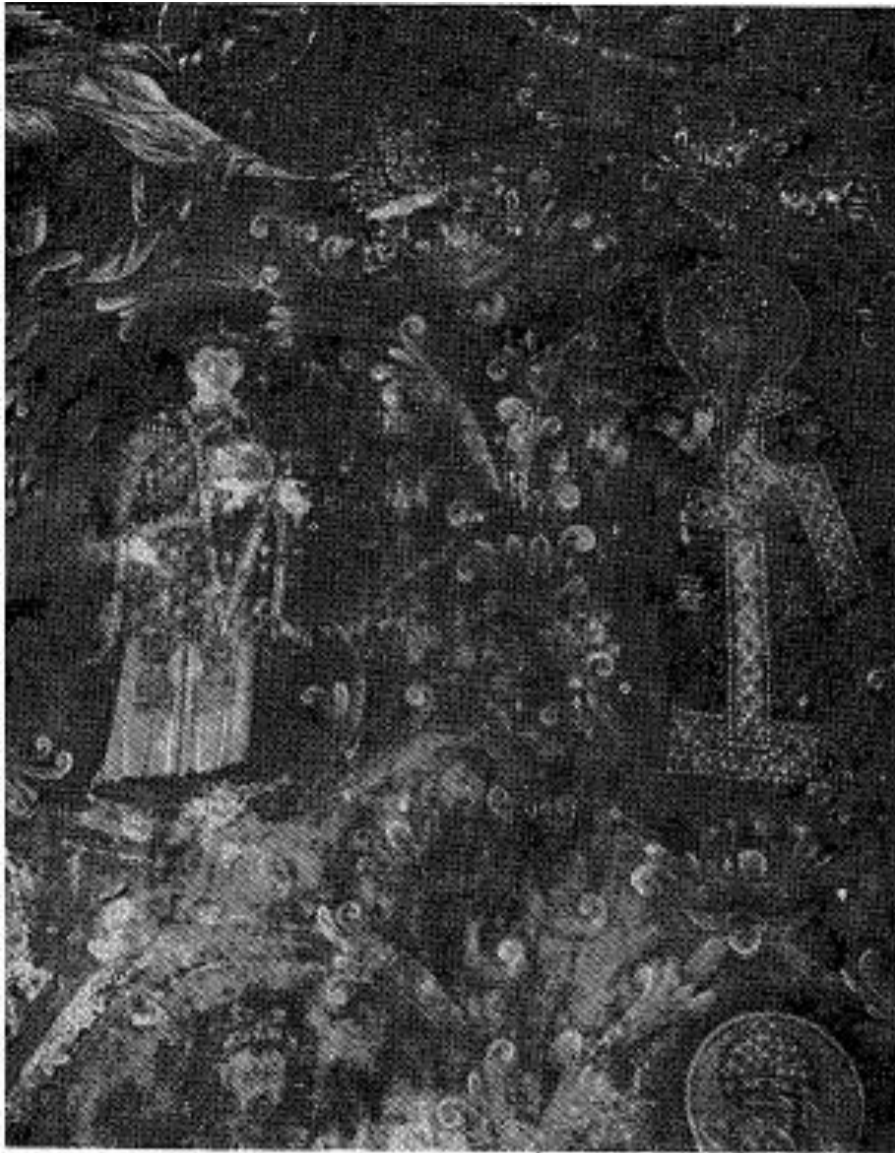
Сл. 4. Лоза Немањића, детаљ: Константин и краљ Милутин, Грачаница, 1318—1321 (фото)

ком она је у принципу одговарала типу владарске композиције са ликовима родитеља и деце, које са неба благосиља Христос. 53 Такав је био мозаик у Кенургиону, који је описао Константин Порфирогенит, на коме су били представљени цар Василије I са женом Јевдокијом и њихова деца, са рукама подигнутим према тријумфалном крсту, очекујући милост и покровитељство са неба. 54 На једној минијатури (fol. 7r) ктиторског типика манастира Богородице Истинске наде (ms. Lincoln College gr. 35 из Бодлејане, 1328—1344) насликани су монаси Јоаким и Теодула, обоје са једном руком молитвено подигнутом према Богородици са Христом, који благосиља обема рукама. Између њих стоји њихова кћи Јефросинија, млада искушеница, такође са рукама подигнутим до груди у ставу молитве. 55 Покојни родитељи, као посредници, препоручују овде кћер Богородици. Јелена и Урош у Грачаници не чине такве гестове, јер као светитељи самим својим присуством обезбеђују посредништво између сина и унука, с једне, и Христа, с друге стране, мада слика има и шире значење. Такво посредништво, у фронталном ставу, обезбеђивао је потомцима св. Симеон Немања у Милешеви и у јужном параклису Студенице (где је уједно и свети патрон), па на одређен начин и у Богородици Љевишкој. 56 Истом типу слике — родитељи са дететом, или децом, које Христос одозго