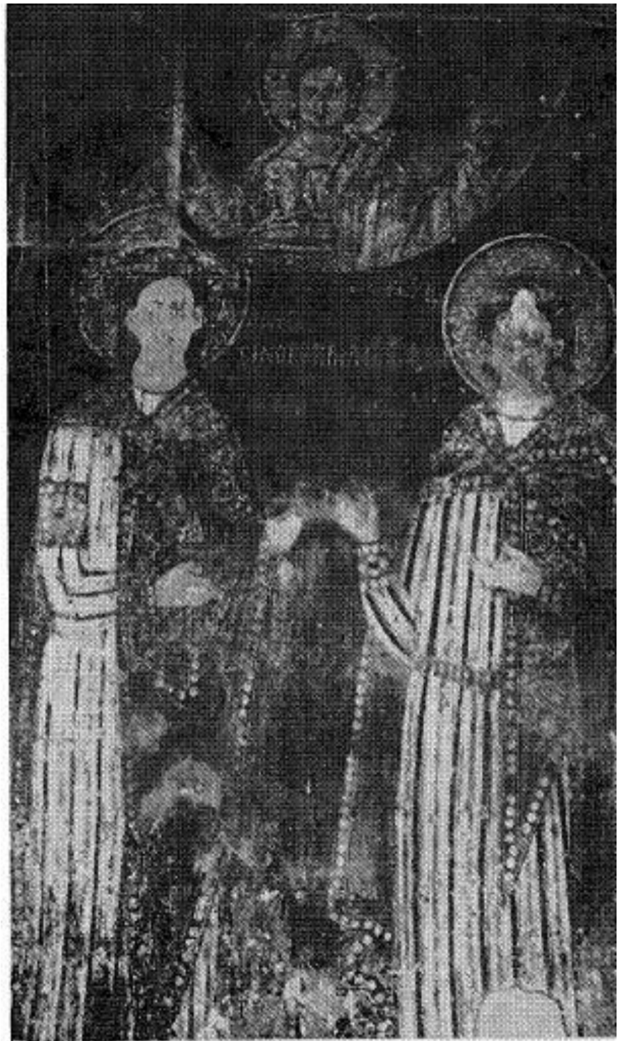
Сл. 5. Владислав, Урошић и Христос Емануил, Ариље, 1296.