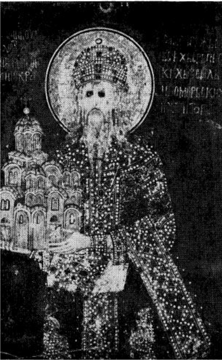
Сл. 7. Краљ Милутин, Грачаница, 1318—1321.