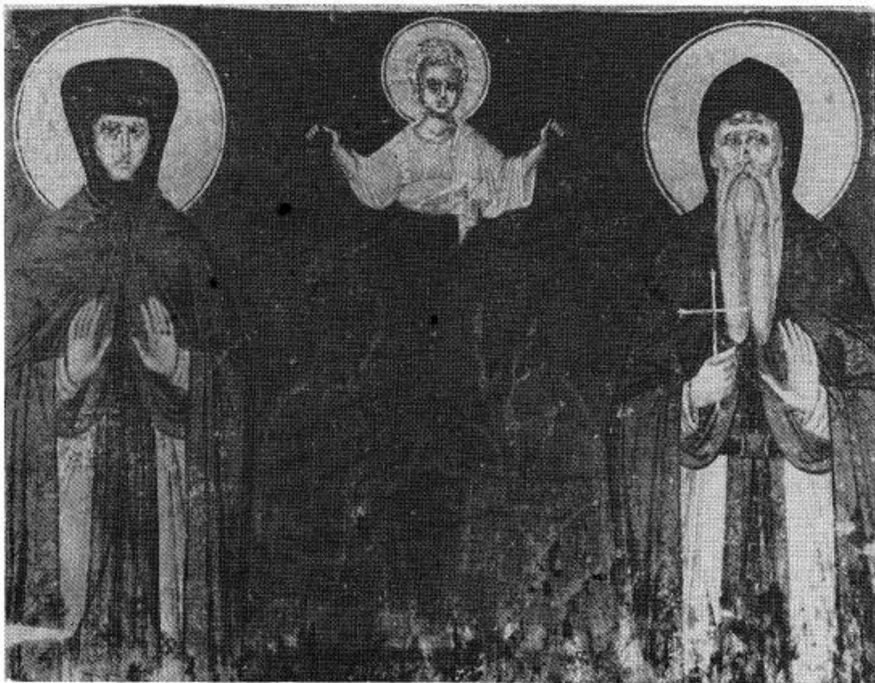
Сл. 1. Краљица Јелена и краљ Урош као монаси, Христос Емануил, Константин и краљ Милутин, Грачаница, 1318—1321 (према: Задужбине Косова)