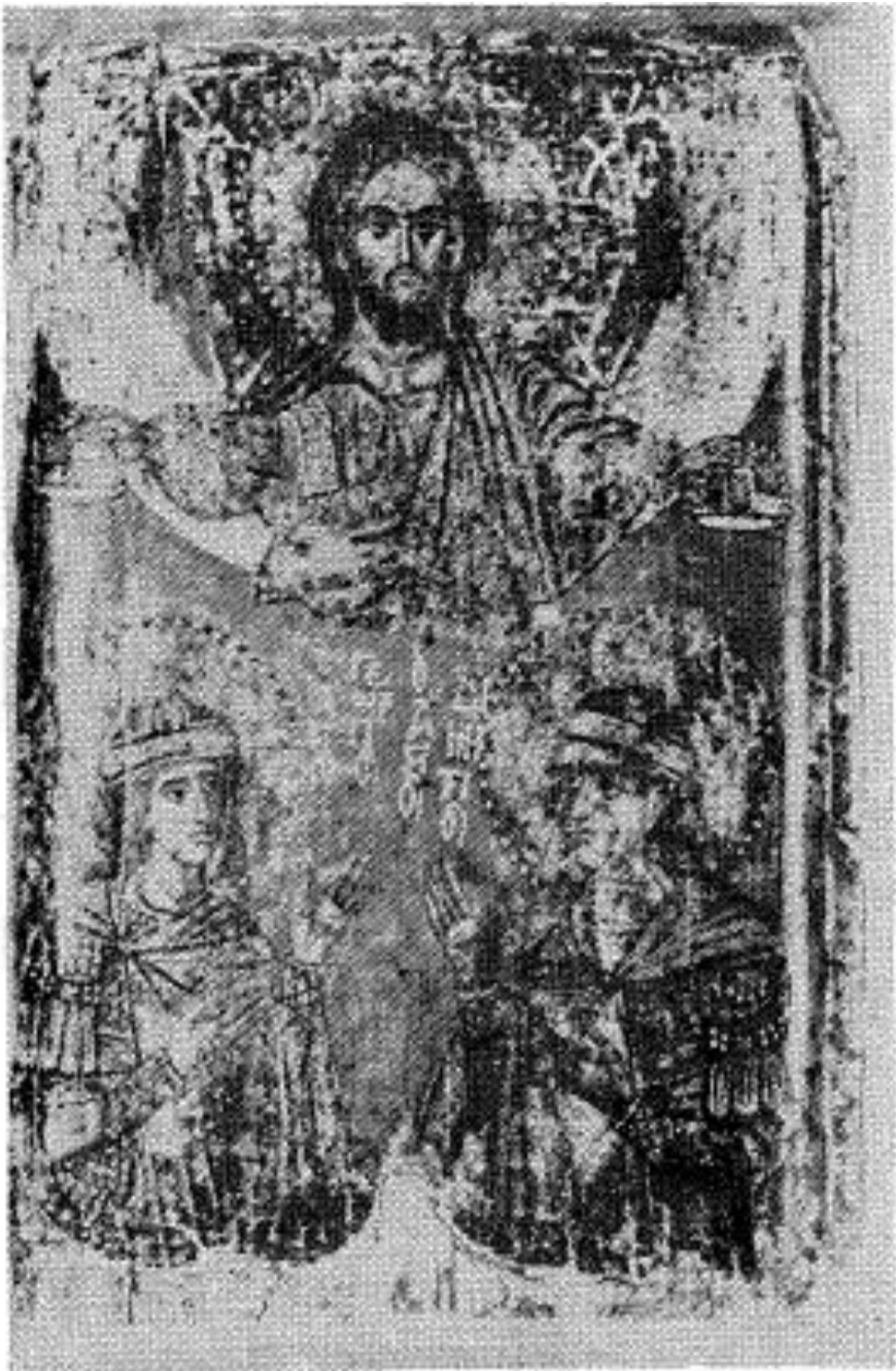
Сл. 6. Христос, св. Георгије и св. Димитрије, икона, крај XIV — почетак XV века, Атина, Музеј Канелопулос (по: Splendeur de Byzance )